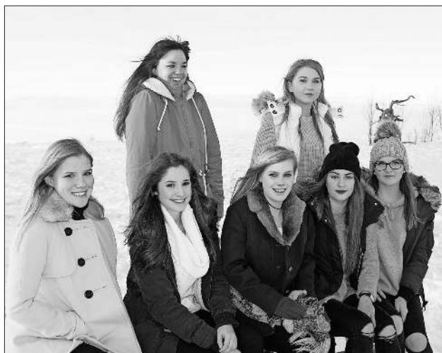
Schneefotoshooting auf dem Kandel.

Die Gruppe trifft sich jeden Donnerstag um 18 Uhr im JuZe Teningen (Wiedlemattenweg 6). Alle Mädchen ab 14 Jahren sind dazu ganz herzlich eingeladen.