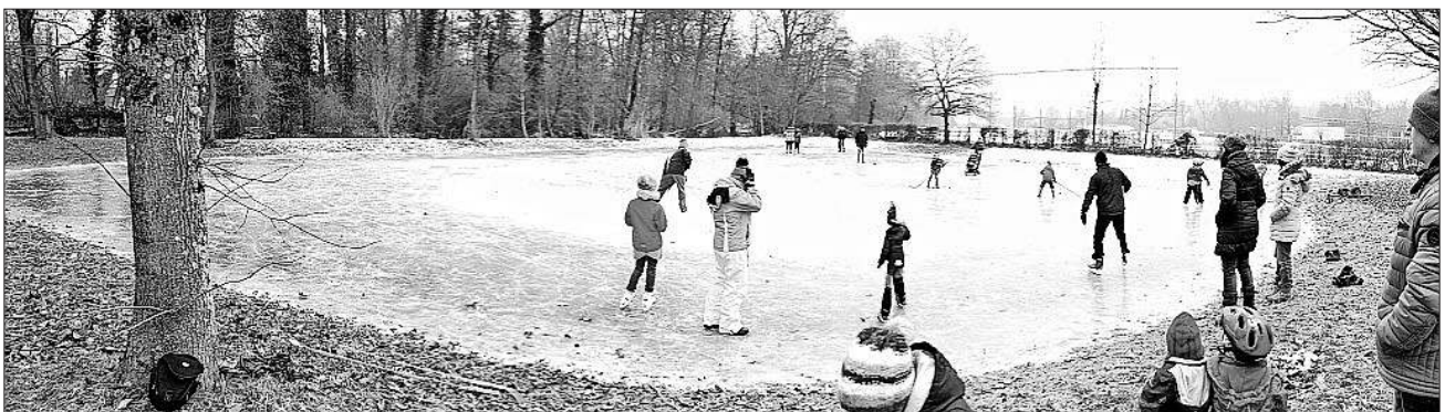
Ein riesen Spaß für Groß und Klein

Wie man auf dem Foto sieht, war auf der Eisfläche die letzten Wochen ein fröhliches Treiben.