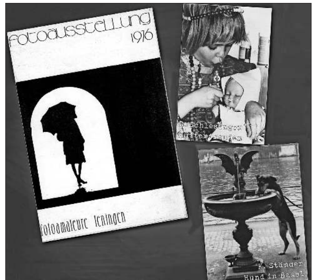
Bilder aus dem Ausstellungsheft von 1968.

Auf der Webseite www.fotoamateure-teningen.de finden sich die jeweiligen Termine zu den Fotoabenden und anderen Veranstaltungen. Unter „40 Jahre Fotoamateure“ lädt der Verein zu einer interessanten Präsentation und lässt so vier Jahrzehnte Vereinsgeschichte passieren.