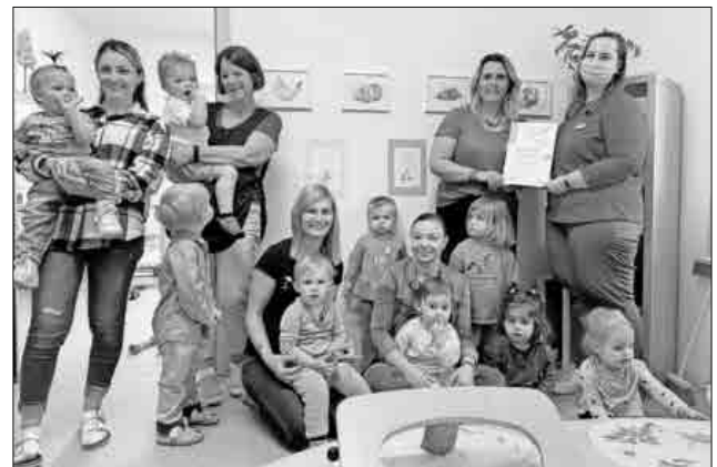
Übergabe der BeKi-Zertifizierung an das Dreikäsehoch-Team.