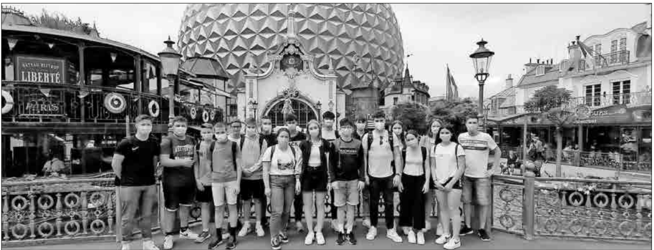
17 Trainees der SpoFunnis verbrachten den ersten Aktionstag im Europa-Park.

Rückfragen sowie weitere Informationen sind auch unter E-Mail spuero@spofunnis.de sowie Telefon 07641 / 9379999 möglich.