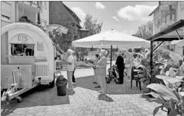
Die Senioren der AWO-Wohnanlage nahmen das Angebot über die verschiedenen Eisbecher gerne an.