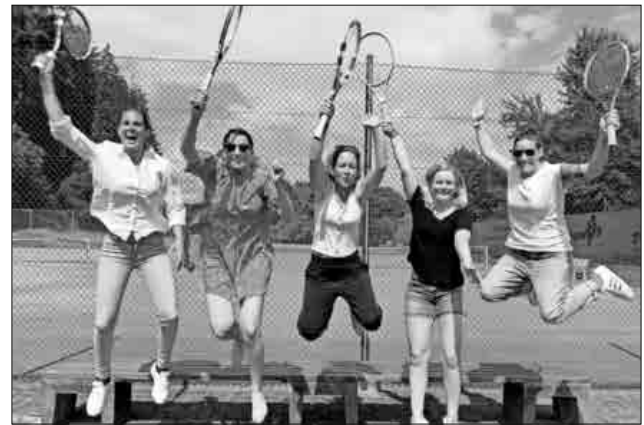
Aufstiegsmannschaft Damen der TSG Köndringen-Heimbach.

Damen 50 (4er): Die Damen 50 mussten zum Saisonabschluss beim TC Meißenheim antreten. Mit einem Sieg wäre auch hier die Vizemeisterschaft möglich gewesen. Guter Dinge reisten die TCK-Damen an. Doch in den Einzeln musste man eines verletzungsbedingt abbrechen und eines knapp im Match-Tiebreak dem Gegner überlassen. Mit dem Rückstand von 1:3 war somit nur noch ein theoretisches Unentschieden möglich. Am Ende konnte man nur ein Doppel für sich entscheiden, was zur 2:4-Niederlage führte. Die Damen 50 schlossen die Saison als Tabellendritte ab. Tolle Leistung, Glückwunsch.