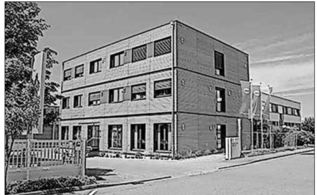
Das neue Bürogebäude in Holz-Modulbauweise.

mit Wärmerückgewinnung und einer Klimatisierung ein angenehmes Raumklima. Die Energie zum Heizen und Kühlen wird in einer Luft-Wärmepumpe erzeugt, die Wärme über Niedrigenergieheizkörper abgibt. Das Gebäude wurde nun an die Mitarbeiter übergeben.