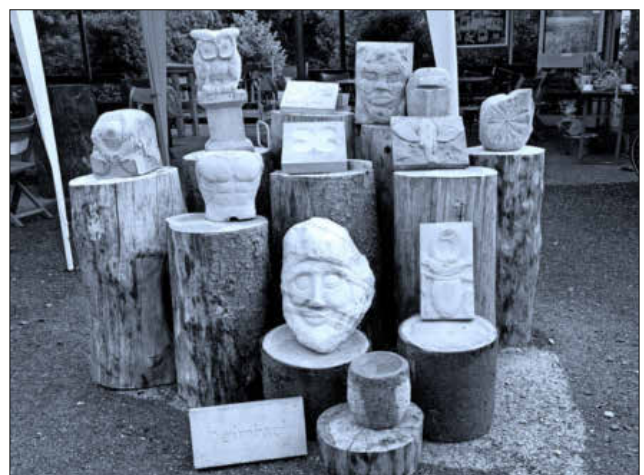
Gelungene Werke aus dem Jahr 2019.

Wenige Plätze sind noch frei; eine Anmeldung ist erforderlich. Anmeldung und weitere Informationen unter g.u.bv.heimbach@gmail.com oder Telefon 07641 / 47102.