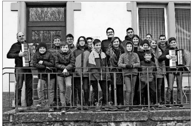
Ein Teil der Teilnehmer vor dem Gruppenhaus in St. Blasien.

Ein herzlicher Dank an das Organisationsteam, vor allem an das Jugendleiter-Team und auch an die Fahrer. Alle waren sich einig: Es war ein tolles Wochenende!