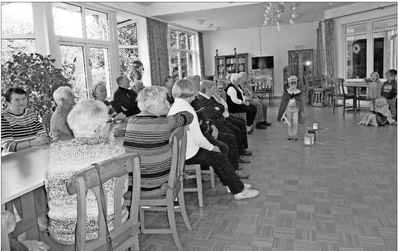
Kindergarten St. Franziskus besuchte die AWO-Seniorenwohnanlage.