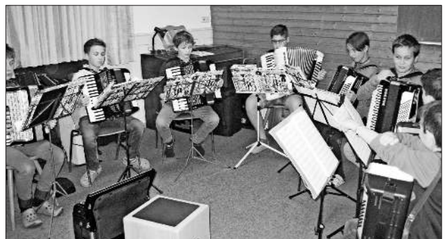
Jugendprobe: In mehreren Probeneinheiten war das Jugendorchester sehr fleißig.