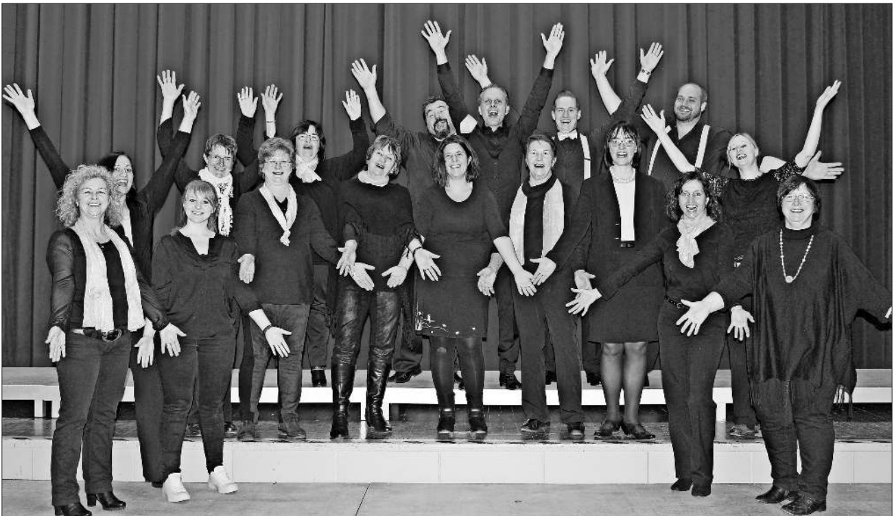
Begeisterung von Quintessenz und für das Publikum mit „viva la musica“.

Sieger und zum Teil Zweitplatzierte haben die Chance, am 10. Deutschen Chorwettbewerb 2018, der in Freiburg ausgetragen wird, teilzunehmen. Vielleicht weckt das ja bei dem ein oder anderen die Lust, diesem vom 5. bis 13. Mai 2018 zuzuhören.