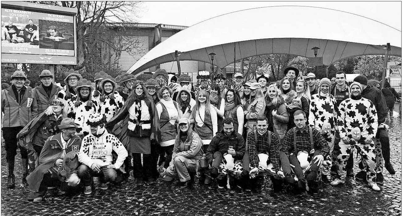
Die Waldteufel in Köln.

Nach einer Übernachtung in der Jugendherberge Köln-Deutz ging es am Sonntag um 11 Uhr wieder zurück.