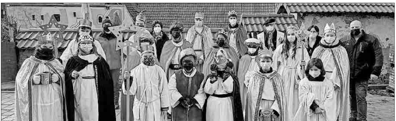
Die Sternsinger unterwegs in Heimbach.

Spenden können noch bis 15. Februar online über die Homepage der katholischen Kirchengemeinde Emmendingen-Teningen ( www.kath-emmendingen.de ) oder auf folgendes Spendenkonto getätigt werden: rk.Kirchengemeinde EM-TE, IBAN: DE73 6805 0101 0020 0146 81, Verwendungszweck: Sternsingeraktion 2022 St. Gallus Heimbach.