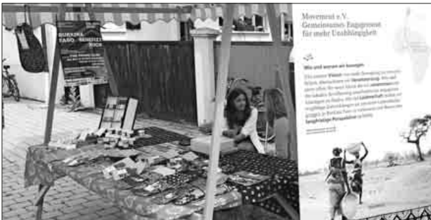
Der Tengerer Entwicklungshilfverein „Movement“ warb um Unterstützung für sein Projekt in Burkina Faso.