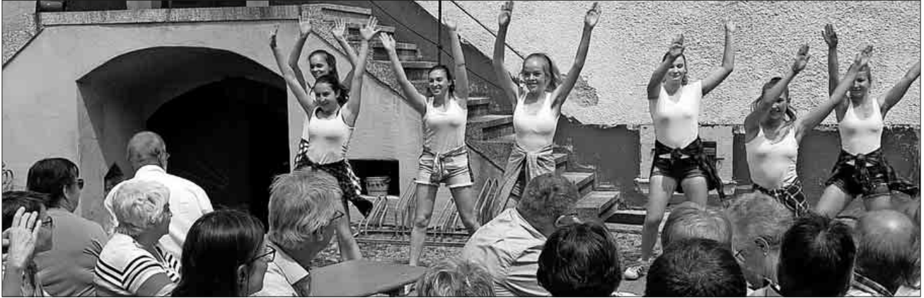
Die Formation Jazz a Nova vom Tanzsportclub Teningen bewies sein Oberligakönnen zur Freude der Applaus spendenden Zuschauerschar.