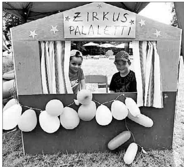
„Hereinspaziert, hereinspaziert..“ Vorhang auf für den Zirkus Palaletti.

Eltern, stärken. Zum Abschluss gab es noch verschiedene Attraktionen für Groß und Klein. Nach einem erlebnisreichen Nachmittag gingen alle müde und zufrieden nach Hause. Die Erziehrinnen und die Kinder danken allen die Sie beim Sommerfest tatkräftig unterstützt haben.