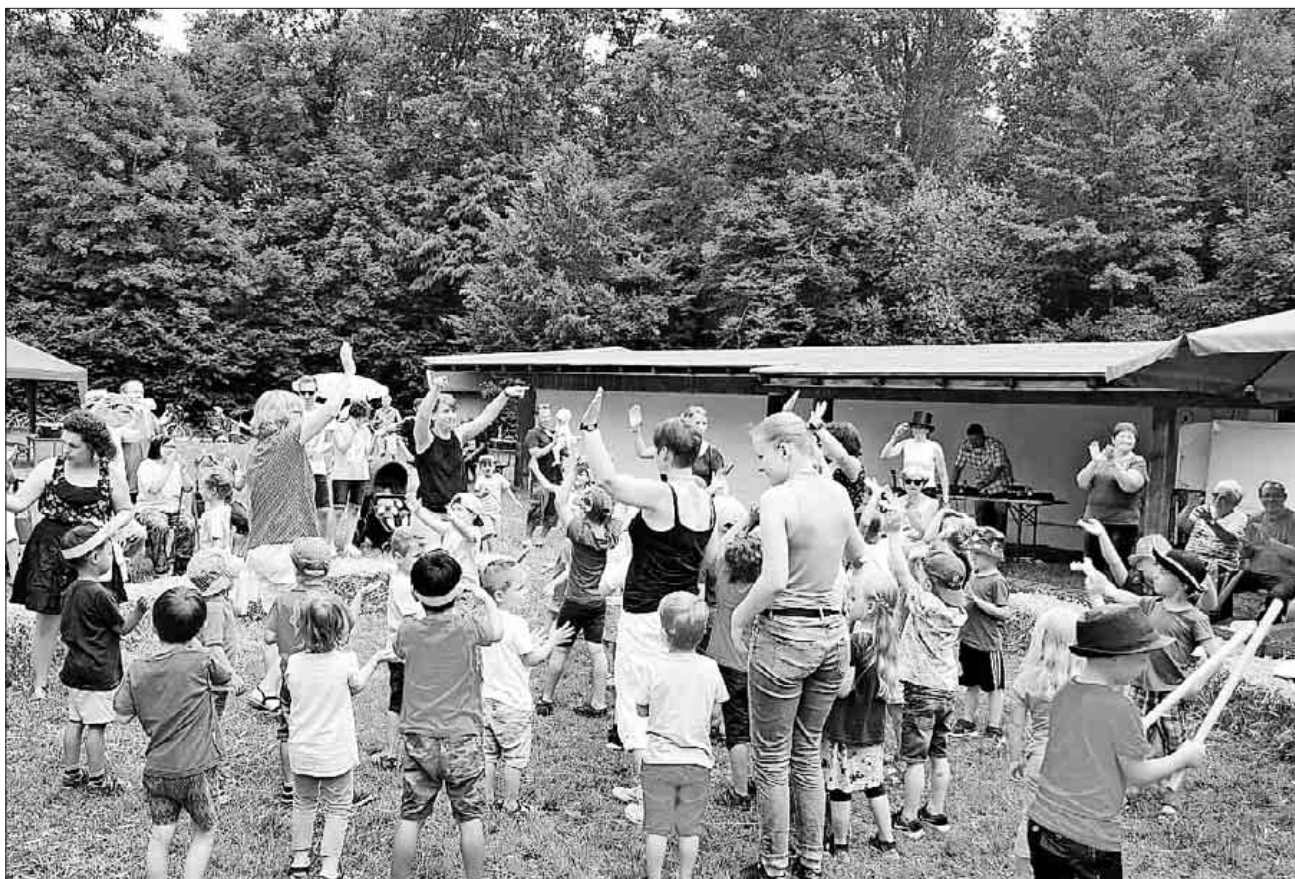
Lieder mit viel Bewegung kamen zum Vortrag.