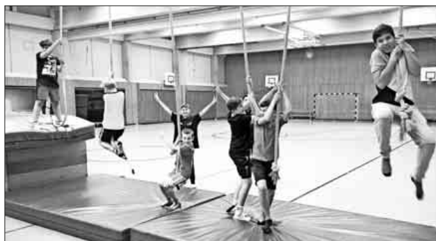
Tarzan beim Ferienprogramm.

Auch in den Sommerferien findet das Ferienprogramm Sport&Fun statt. Vom 27. bis 31. August und vom 3. bis 7. September sind Kinder und Jugendliche im Alter von sechs bis 13 Jahren in die Ludwig-Jahn-Halle in Teningen eingeladen. Für weitere Infos zu Sport&Fun in den Sommerferien sowie zu allen anderen Programmen stehen die SpoFunnis-Mitarbeiter unter der Nummer 07641 / 9379999 oder per Email spuero@spofunnis.de zur Verfügung. Gerne dazu auch die Internetseite von SpoFunnis www.spofunnis.de besuchen.