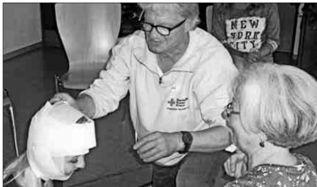
Auch Verbände, wie hier einen Kopfverband, wurden geübt.