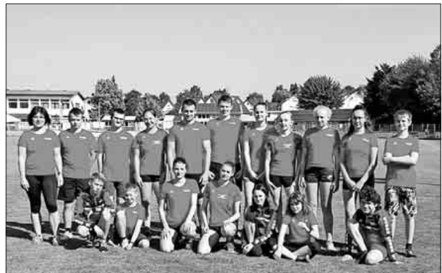
TuS-Leichtathleten im Trainingslager in Neckarelz.