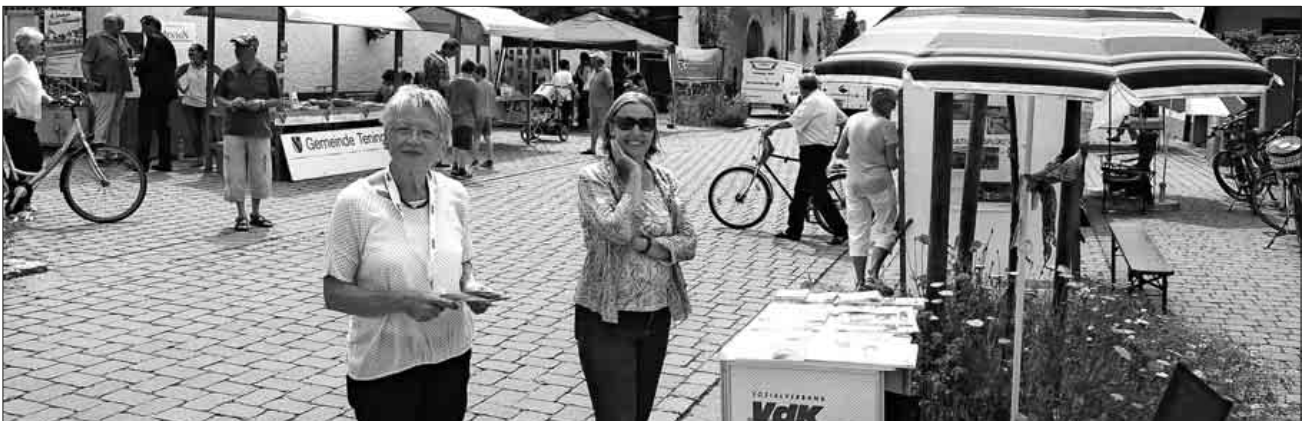
Zum ersten Mal stand die Kirchstraße für Informationsstände der Tengerer Vereine zur Verfügung.