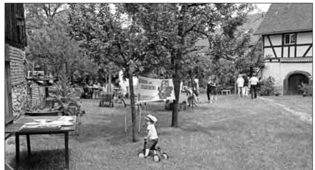
Das Kinder- und Jugendbüro hatte ein gutes Programm für die Jugend dabei, das gerne angenommen wurde.