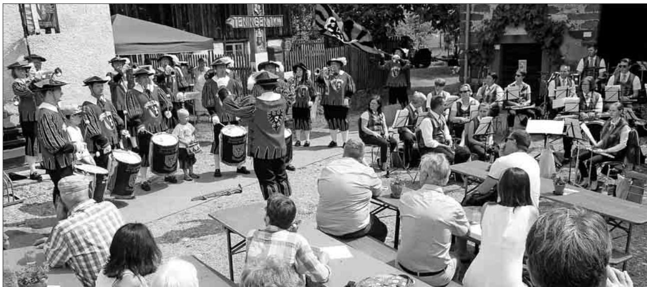
Fanfarenzug und Musik und Feuerwehrkapelle bereicherten das Programm beim fünften Teninger Begegnung Markt.