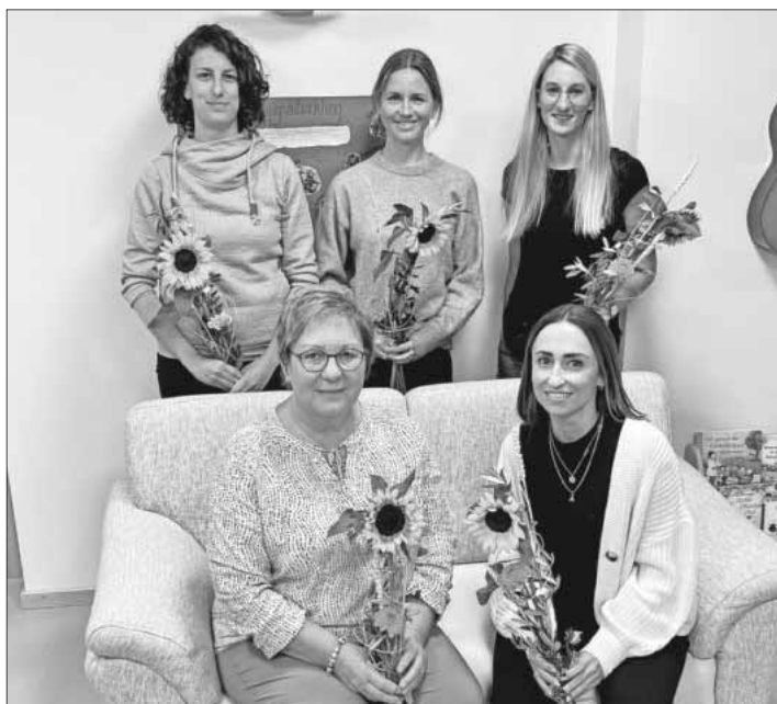
Die neue Vorstandschaft von Zeit.Raum.Kinder.

Der Verein bietet außerdem immer wieder öffentliche Angebote zur Elternbildung und Unterstützung für alle Familien. Ab Januar 2024 soll ein SpielRaum für Kinder von fünf bis neun Monaten angeboten werden.