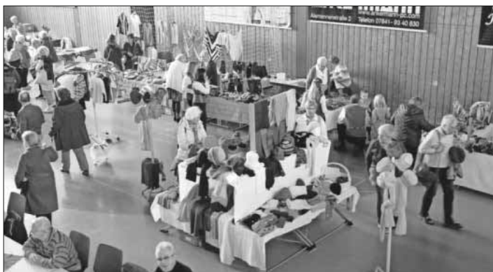
Großes Angebot an schönen und nützlichen Dingen beim Basar.

Den Erlös des Basars wird der Ortsverein Teningen auch in diesem Jahr wieder für wohltätige Zwecke, besonders in der Vorweihnachtszeit, verwenden. Hierzu wird noch die Mithilfe der Bevölkerung benötigt (siehe weiterer Artikel).