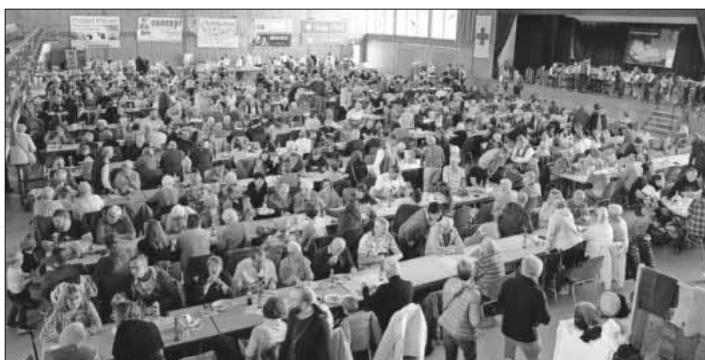
Die Ludwig-Jahn-Halle war zur Mittagszeit gut gefüllt.