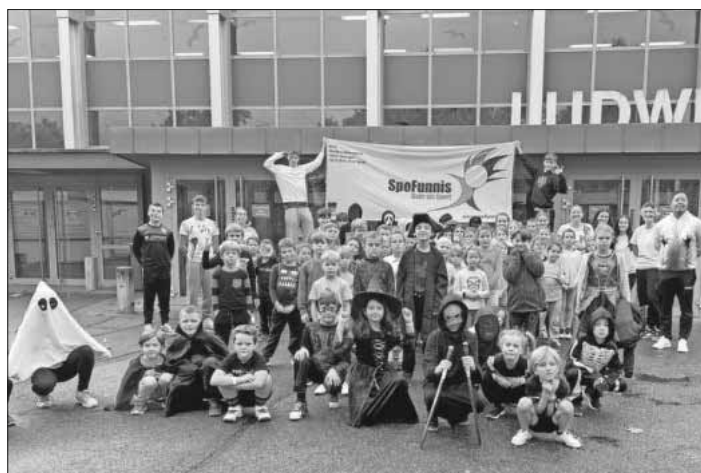
Die Mitarbeitenden und die teilnehmenden Kinder beim Herbstferienprogramm am Halloween-Tag.

Das nächste Angebot von SpoFunnis wird das Hallenferienprogramm Sport&Fun in den Faschnachtsferien vom 14. bis 16. Februar 2024 sein. Anmeldung ist ab sofort möglich unter 07641/9379999 oder unter spuero@spofunnis.de . Weitere Infos zu den SpoFunnis sind auf der Homepage www.spofunnis.de zu finden.