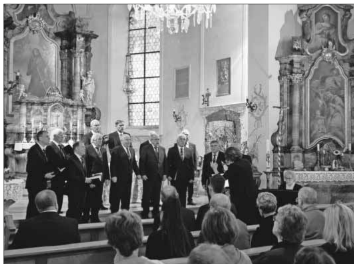
Männerchor Heimbach in der St.-Gallus-Kirche.