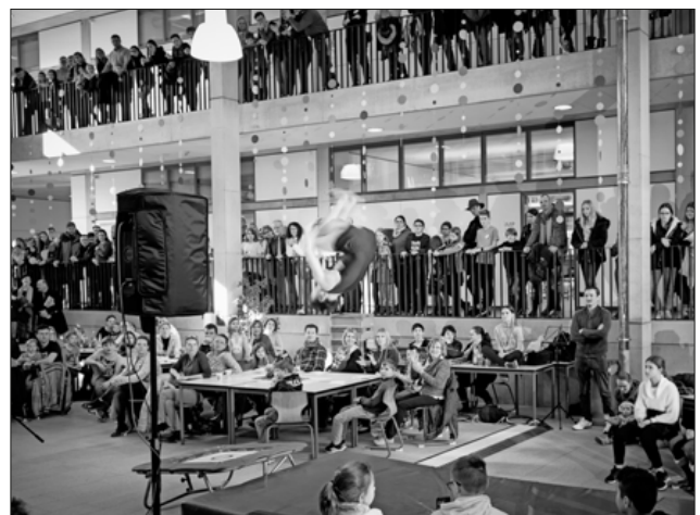
Die Turn-AG präsentiert im voll besetzten Atrium die gekonnt einstudierte Choreografie.