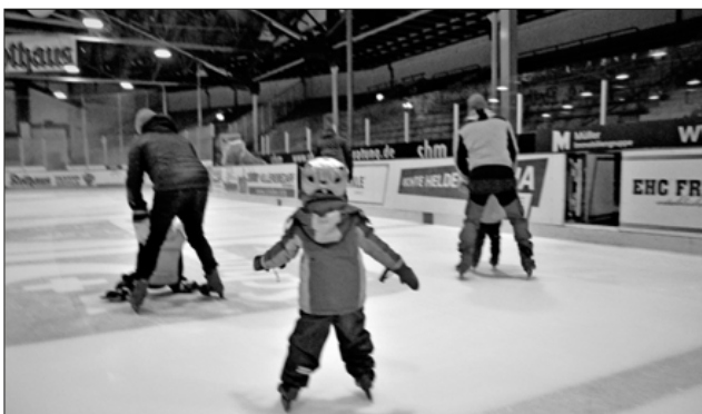
Der Teninger Waldkindergarten auf dem Eis.

Die beiden Gruppen des Waldkindergartens, Grashüpfer wie Waschbären, besuchten vor 14 Tagen die Eishalle in Freiburg. Schon der gemeinsame Weg dorthin geriet für viele Kinder zu einer aufregenden Sache. Vom Bahnhof Emmendingen aus starteten etwas mehr als dreißig Kinder mit der Bahn Richtung Freiburg. Von dort aus fuhr man diszipliniert mit der Straßenbahn zur Halle. Viele Kinder standen zum ersten Mal auf Schlittschuhen und waren trotz der unvermeidlichen Stürze mit guter Laune und viel Spaß dabei. Natürlich war es auch jederzeit möglich, auf der Tribüne ein kurzes Püschchen einzulegen, um den anderen Kindern auf der Eisbahn zuzuschauen. Das gemeinsame Vesper im ungekünstelten Ambiente des Eingangsbereichs bildete einen weiteren Höhepunkt der kleinen Reise. Die Eishalle in Freiburg wird ganz sicher einen festen Platz im Erinnerungsschatz eines jeden Waldkindergartenkindes behalten.