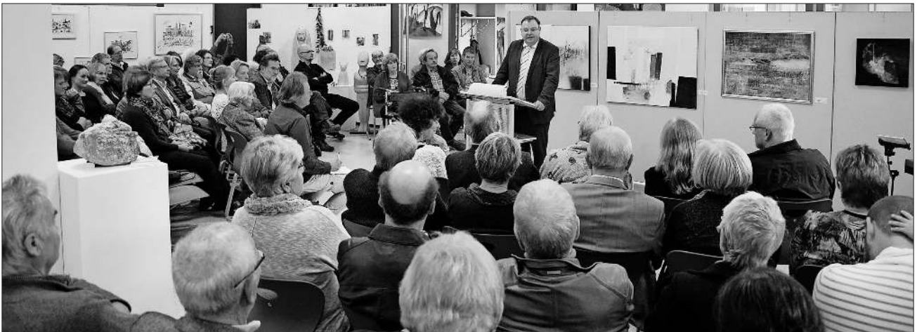
Bürgermeister Hagenacker bei der Eröffnung der Teninger Kunstausstellung.

Nach dem Sektempfang nutzte das Publikum die Möglichkeit, sich von der viel zitierten Vielfalt selbst ein Bild zu machen. Hierbei kam es zu einem regen Austausch zwischen Kunstschaffenden und -interessierten.