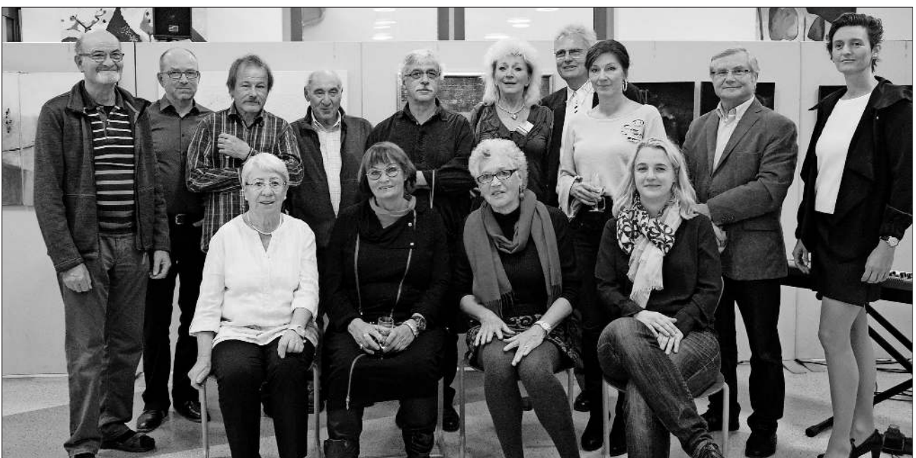
Gruppenfoto der Künstler.