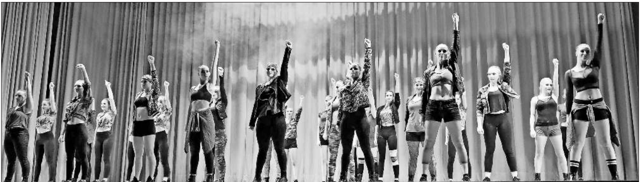
Der Start in ein furioses Jubiläum.