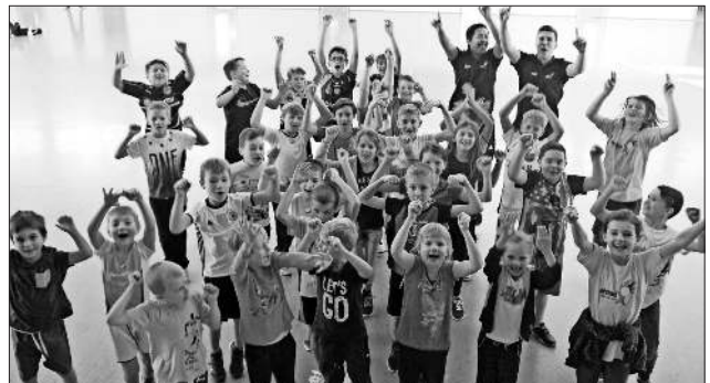
Teilnehmer und Mitarbeiter beim Ferienprogramm.

Das nächste große SpoFunnis-Event ist das WinterCamp18 vom 2. bis 6. Januar 2018. Für dieses Camp im Schwarzwald in der Nähe des Feldbergs gibt es noch freie Plätze. Anmelden dürfen sich Teilnehmer im Alter von acht bis 13 Jahren. Anmeldung ist per Email oder telefonisch möglich unter 07641 / 9379999 oder spuero@spofunnis.de. Unter diesen Kontaktdaten können auch weitere Infos erfragt werden. Bitte dazu auch die Internetseite von SpoFunnis www.spofunnis.de beachten.