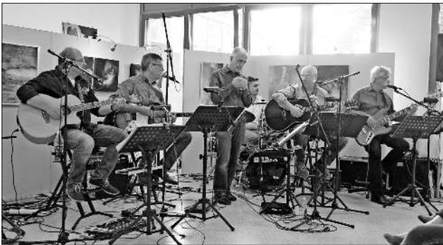
Die Band Spätzünder & Friends, eine Heimbacher Formation.