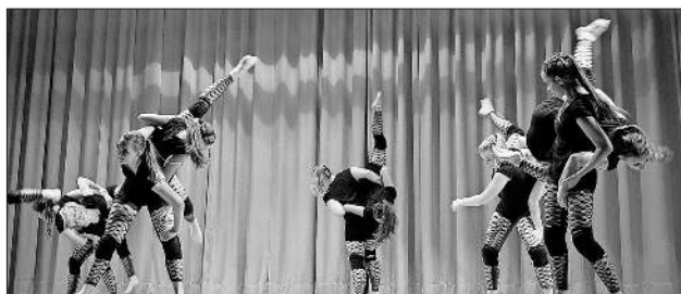
„Transmission“, getanzt von Jazz a Nova.