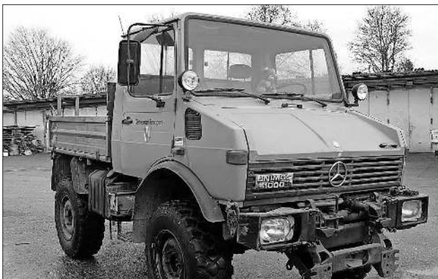
Unimog zu verkaufen.