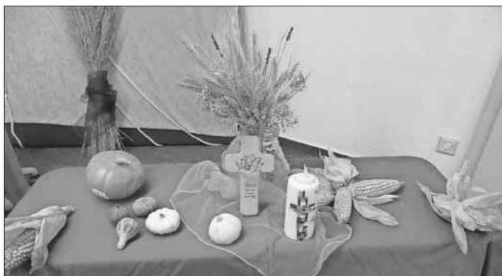
Erntedank im Kindergarten St. Anna.