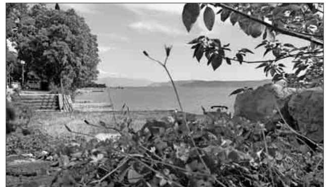
Wandern unter dem Motto „Inselträume Kroatiens“.

Der Teninger Schwarzwaldverein organisiert von Donnerstag, 3. bis Donnerstag, 10. Mai, eine Flug- und Wanderreise nach Kroatien. Auf die Teilnehmer warten die schönsten Inseln der Kvarner Bucht und Plitvicer Seen. Berühmt wurden sie als Drehort vieler Karl-May-Filme. Der Veranstalter teilt mit, dass die Wanderreise mit 38 Teilnehmern ausgebucht ist. Kontakt: Telefon 07641 / 47559.