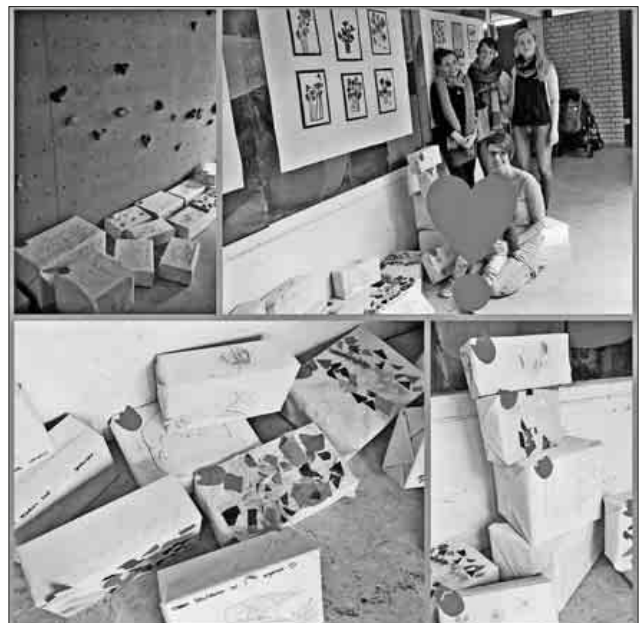
Bunte Schuhkartons, gefüllt mit Kleidung und Spielzeug, das die Kita Dreikäsehoch spendete.

Anschließend konnte die liebevolle Einrichtung besichtigt werden und man tauschte sich mit den netten Mitarbeitern aus. Die Spendenüberbringer haben sich fest vorgenommen, wiederzukommen!