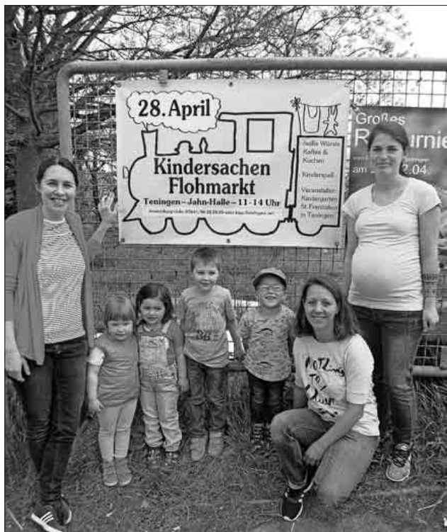
Mit Hilfe der Kinder wurden am Wochenende die Werbebanner aufgehängt.

Das Orga-Team sorgt für Speisen und Getränke und es gibt eine große Kuchen-Theke mit über 50 leckeren Kuchen. Ein großes Rahmenprogramm rundet den Flohmarkt ab. Der gesamte Erlös kommt den Projekten des Kindergartens St. Franziskus zugute.