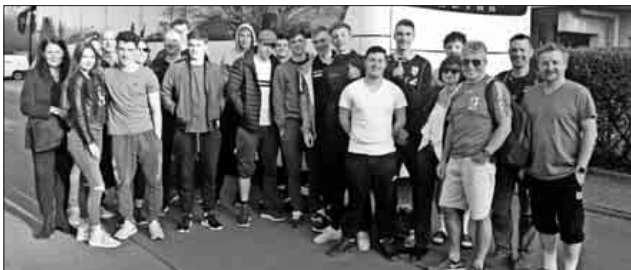
A-Jugend der SG Köndringen-Teningen in Kornwestheim.