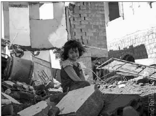
Islamic Relief Jemen

Da das Ferienprogramm in seiner geplanten Form in den Osterferien nicht stattfinden kann, werden die SpoFunnis die Bevölkerung darüber in Kenntnis setzen, ob und wann eine Notfallbetreuung möglich ist. Bei weiteren Fragen stehen die SpoFunnis-Mitarbeiter unter Telefon 07641 / 9379999 oder per E-Mail spuero@spofunnis.de gerne zur Verfügung.