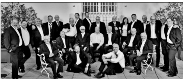
Der Männerchor Heimbach am 27. Oktober 2019 im neuen Schloss Heimbach.

in der Baumschule Hügler am Sonntagnachmittag, 5. Juli. Verleihung der Conradin-Kreutzer-Tafel in Überlingen am Samstag, 11. Juli, beim Landesmusikfestival. Liederabend „Unter Freunden“ in der Anton-Götz-Halle in Heimbach am Samstagabend, 7. November. Einblicke in die Aktivitäten des Chores und weitere Informationen finden sich auch unter www.maennerchor-heimbach.de .