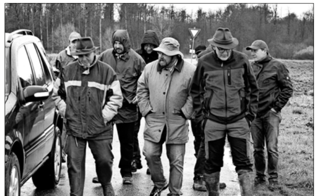
Für Bürgermeister Heinz-Rudolf Hagenacker sind die Flurbegehungen eine willkommene Gelegenheit, mit den Landwirten vor Ort die Probleme zu besprechen.

Auch bei dieser Flurbegehung wies er nochmals auf die Städte-Land-Partnerschaft hin. Denn bedauerlicherweise würde das Angebot zur Selbstvermarktung nicht so angenommen wie gewünscht. Hierzu sollte man nochmals gemeinsam über die Strategien reden.