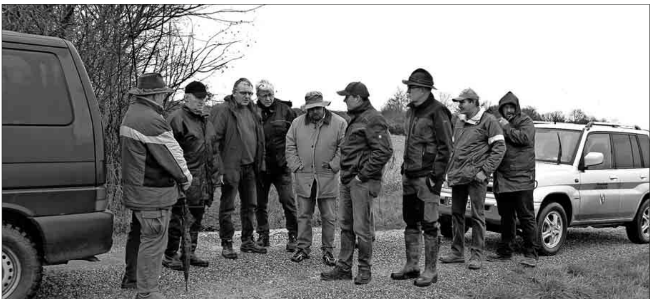
Immer wieder sind es auch die Entwässerungsgräben, die Anlass zu Mängeln bieten. Im Großen und Ganzen wird ihr Zustand jedoch als gut gepflegt beurteilt.