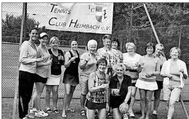
So ist es richtig – wenn schon Prosecco-Cup, dann müssen die Voraussetzungen auch stimmen. Und bei den Heimbacher Tennisdamen stimmte der Turnier-Titel, wie man hier sehen kann.

Das nächste Ereignis beim TCH steht schon an. Dann dürfen auch wieder die Herren mit auf den Court. Am 29. Juli wird die Club-Mixedmeisterschaft ausgetragen und anschließend mit einem Sommerfest auf der heimischen Anlage die Tennissaison gefeiert.