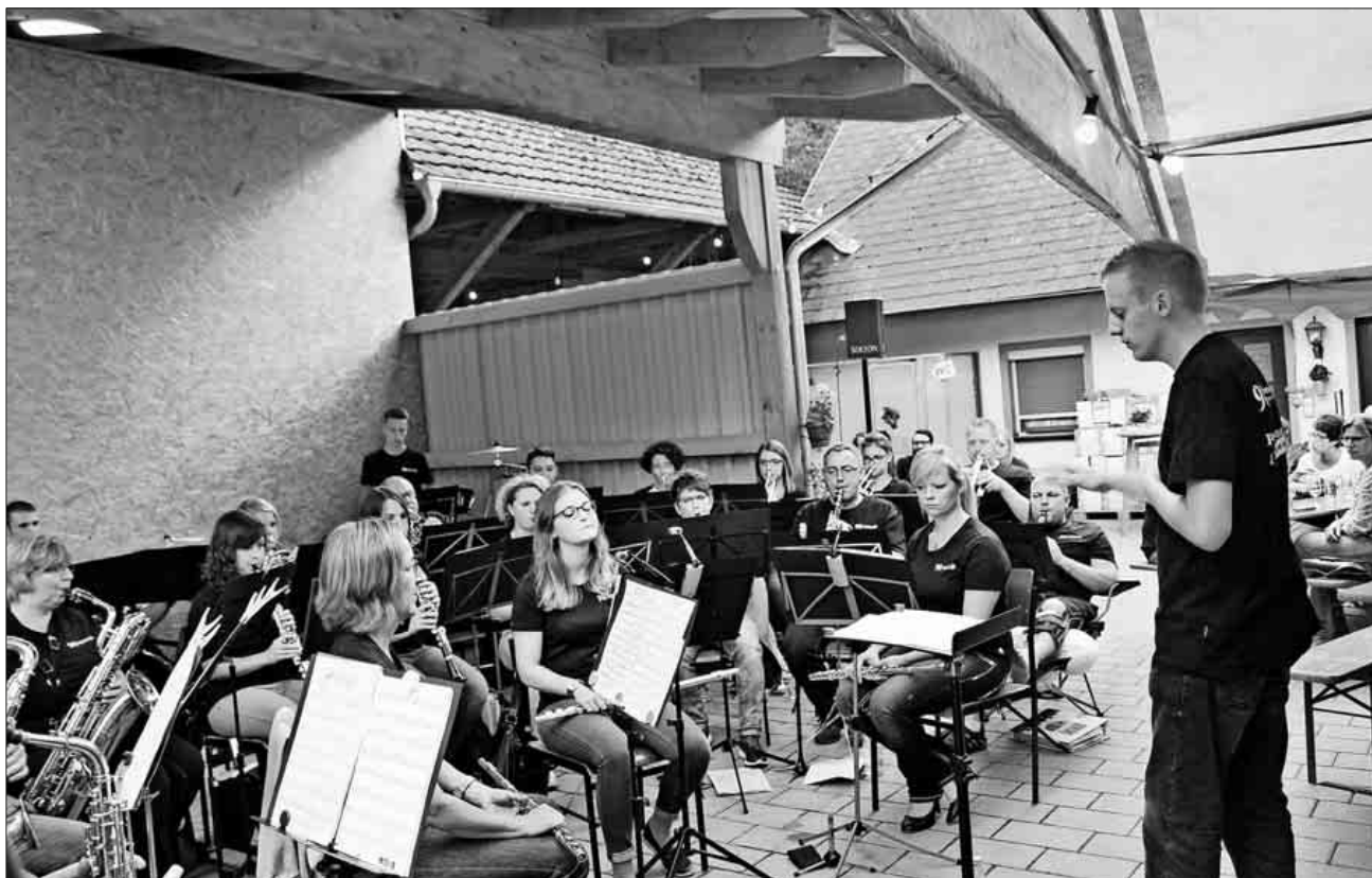
Das Konzert des Projektorchesters konnte am Samstagabend viele Zuhörer begrüßen.