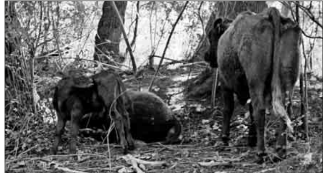
Salers-Rinder im Taubergießen.

Erstaunt waren die Teilnehmerinnen und Teilnehmer über den Anblick grasender Rinder am Ufer des Flusses. Der Boots-