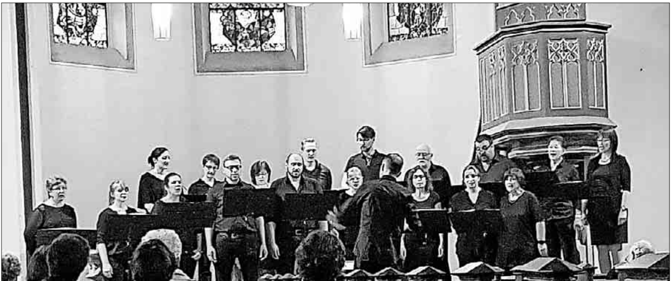
Der gemischte Chor Quintessenz bei seinem Auftritt.

Eine Übersetzungsbeilage im Programmheft erleichterte das Verständnis für Vorträge in französisch, italienisch, schwedisch und englisch. Eine Vielfalt, die nicht nur den Zuhörern gefiel – wie der Beifall zeigte, sondern auch sichtlich den Sängerinnen und Sängern. Anschließend gab es einen gemütlichen Umtrunk im Pfarrgarten, bei dem die Musik im Gespräch noch nachklingen konnte.