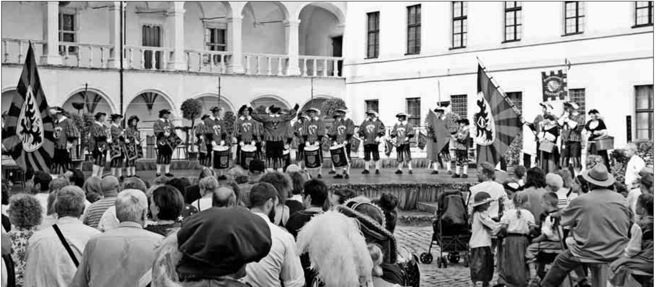
Der Fanfarenzug beim Auftritt im Schlosshof.

Bilder zum Auftritt in Neuburg sowie weitere Infos zum Verein auf www.ffz-teningen.de .