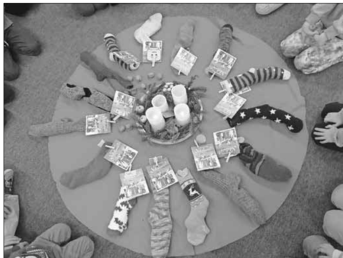
Freude über die gefüllten Nikolaussocken.