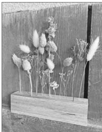
Gestaltung eines Holzklötzchens mit Trockenblumen.

Aufgrund der großen Nachfrage werden zwei weitere Termine angeboten: Donnerstag 13. Juli und 3. August, jeweils 19.30 Uhr. Kursgebühr 8 Euro Mitglieder / 18 Euro Nichtmitglieder, zusätzlich fallen Materialkosten von 20 Euro an. Info und Anmeldung bei Steffi Weiler, Mobil 0175 / 1622011.