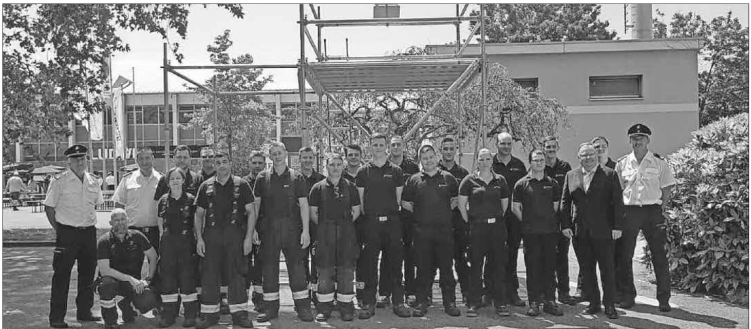
Die Gruppe der Feuerwehr Teningen – Abteilung Köndringen-, die das Leistungsabzeichen in Silber, und die Gruppe der Feuerwehr Teningen – Abteilung Teningen-, die das Leistungsabzeichen in Gold absolvierten.