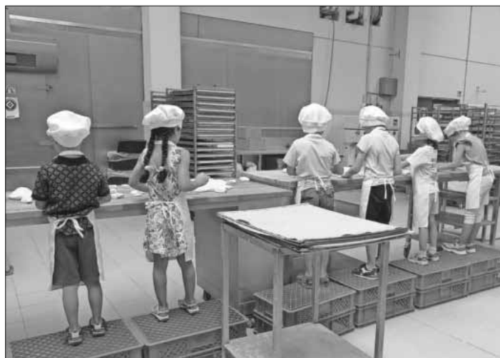
Schulanfängerausflug in die Bäckerei Ritter in Vörsstetten.