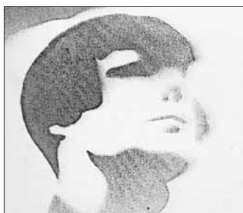
Stencil / Fotografie von László Moholy-Nagy.

Bis zu den Sommerferien präsentiert die Kunst-AG der Theodor-Frank-Schule unter Leitung der Kunstlehrerin Annette Stark im Rebay-Haus in Teningen verschiedene Schülerarbeiten aus dem Unterricht. Die kleine Kunstaussstellung „School-art 5“ im Erdgeschoss kann zu den regulären Öffnungszeiten sonntags von 14 bis 17 Uhr besichtigt werden.