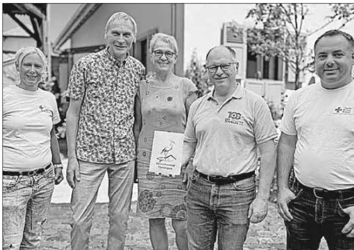
Die bei der Benefiz-Matinee im Storchenhof gesammelte Spende wurde dem DRK Teningen übergeben.

Der Storchenhof Teningen bedankt sich im Namen des DRK-Ortsvereins herzlich bei den Spendenden. Es ist eine Freude, zu spüren, dass die Teninger Bürgerinnen und Bürger so viel Interesse an sozialen Projekten zeigen. Auch zukünftig werden gemeinnützige Themen in den Mittelpunkt der Matinee-Reihe gestellt werden.