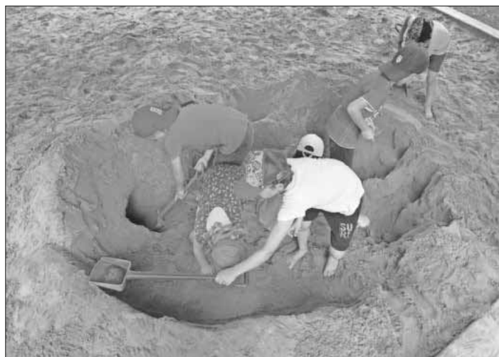
Sommerliche Sand- und Wasserspiele im Außenbereich.