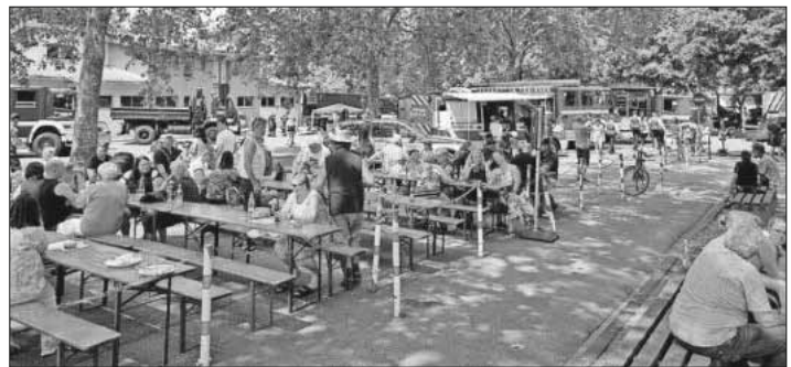
Das Jubiläumsfest war gut besucht.