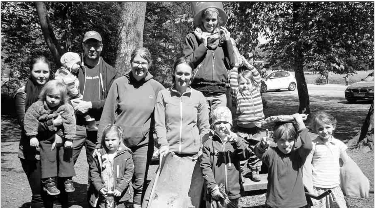
Einige große und kleine Helfer des Natur- und Waldkindergartens beim Waldputzen.

auf die Suche nach menschlichen Hinterlassenschaften gemacht. Zur Belohnung gab es für alle eine wohlverdiente Bratwurst. Einen herzlichen Dank an alle Beteiligten für ihr Engagement.