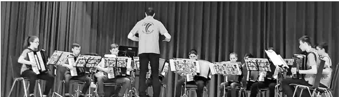
Die Jugend auf der großen Bühne.