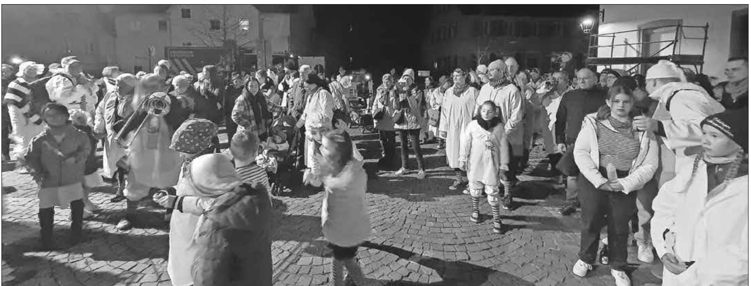
Buntes Treiben am Schmutzigen Dunschdig auf dem Teninger Rathausplatz.