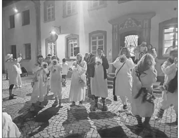
Musikalisch untermalt wurde der Abend von der „Ramba Zamba Wiebergugge“.