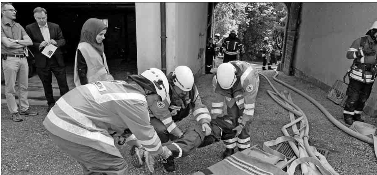
Beim DRK funktioniert die Integration.