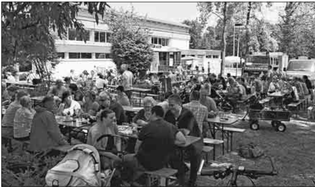
Gut besuchter Vatertagshock 2017.

Die Abteilung Nimburg-Bottingen veranstaltet am Donnerstag, 10. Mai , ihren Vatertagshock an der Nimberghalle in Nimburg. Auf die Besucher wartet ein reichhaltiges Speise- und Getränkeangebot wie zum Beispiel Gyros mit Pommes frites und Zaziki, Curry- und Grillwürste, Weizenbier, Bier, Wein und natürlich auch antialkoholische Getränke. Nachmittags gibt es auch Kaffee und Kuchen in einer idyllischen Umgebung direkt an der Glotter mit großen Bäumen und Sonnenschirmen. Auf die kleinen Gäste wartet ein Spielbereich mit einer großen Auswahl an Spielen aus dem Spielmobil der Gemeinde Teningen. Bei hoffentlich schönstem Maiwetter freuen sich die Kameraden der Feuerwehr auf regen Besuch.