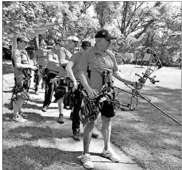
„Alle ins Gold“