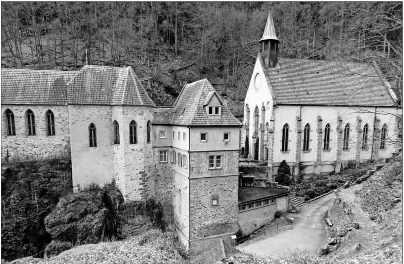
Wallfahrtskirche von Dusenbach.

Der Rückweg nach Ribeauvillé mit einer kleinen Einkehr zum Abschluss rundete diesen Wandertag ab. Der Bus brachte die Teilnehmer mit vielen schönen Eindrücken wieder nach Hause.