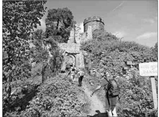
Burgruine von Ribeaupierre.

Kirche und Kapelle wurden besichtigt. Die Pilgergaststätte Ermitage de Dusenbach mit seinen Kapuziner-Mönchen versorgten die Wanderer mit Getränken und selbstgemachten Kuchen.