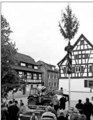
Großes Interesse beim Stellen des Maibaumes.

Die Nimburger Felse-Trieber bedanken sich recht herzlich bei allen, die beim diesjährigen Maibaumstellen in der Walpurgisnacht mit anschließendem gemütlichen Beisammensein dabei waren.