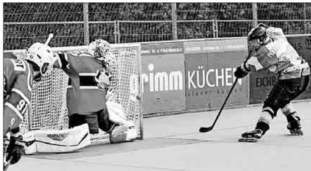
Philipp Cherubim erzielt den 4:5-Anschlusstreffer für die Nimburger Herrenmannschaft.

Nachwuchstraining findet immer montags und donnerstags um 18 Uhr am Nimburger Inlinehockeyplatz statt.