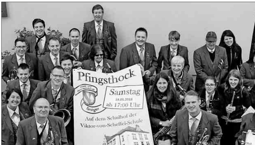
Die Musikerinnen und Musiker der Musik- und Feuerwehrkapelle Teningen freuen sich auf alle Besucher beim diesjährigen Pfingsthoek.

Nach dem Wetterglück im letzten Jahr hoffen die Musikerinnen und Musiker der Musik- und Feuerwehrkapelle Teningen auch in diesem Jahr auf einen warmen, frühlingshaften Abend und laden herzlich zu ihrem Pfingsthoek ein. Für das leibliche Wohl wird ab 17 Uhr unter anderem mit Grillwürsten, Winzerwecke und frisch gezapftem Bier gesorgt sein. Ein besonderes Ambiente verspricht schon der schöne Platz um das imposante Gebäude der Viktor-von-Scheffel-Schule im Teninger Unterdorf. Für die richtige Stimmung wird zusätzlich durch die Freunde des Musikvereins Maleck und des Musikvereins Hecklingen, welcher bereits vor drei Jahren zur Pfingsthoekpremiere spielte, gesorgt. Mit dem nötigen Wissen und etwas Glück haben alle Besucher beim kostenlosen Quiz die Chance auf tolle Preise. Als besonderes Highlight für die kleineren Gäste wird es dieses Jahr neben der gewohnten Spielecke auch wieder eine Hüpfburg geben. Die Bewir-