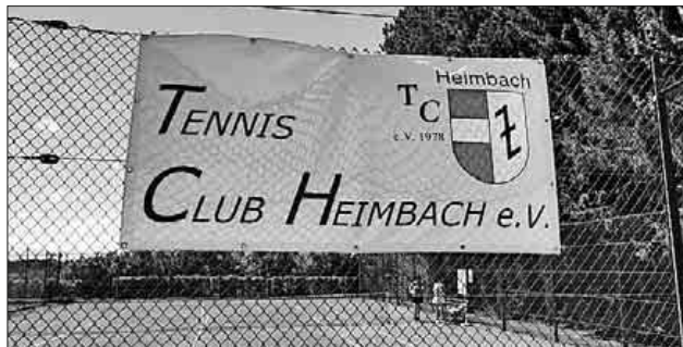
Der Tennisclub Heimbach im Jubiläumsjahr.

te sich am vergangenen Sonntag mit einem 3:6 und wird am kommenden Sonntag beim zweiten Spiel auf das Team von Waldkirch treffen. Dann auf heimischen Boden und mit der Hoffnung, dass die Unterstützung der Clubmitglieder vielleicht auch eine tragende Rolle spielen wird. Los geht's um 9.30 Uhr auf dem Tennisplatz des TC Heimbach.