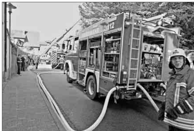
Für die Übung musste die Köndringer Straße komplett gesperrt werden.

Angenommen wurde, dass, verursacht bei Renovierungsarbeiten, ein Brand im Gästehaus ausgebrochen ist und sich ein Handwerker durch einen Sprung aus dem Fenster verletzt nach draußen retten konnte. Zwei weitere Kollegen waren allerdings noch im Gebäude. Eine Aufgabe der Jugendfeuerwehr, die die Verletzten darstellten. Bereits beim Eintreffen des ersten Einsatzfahrzeuges brannte der Dachstuhl. Die Erstmaßnahmen durch die Abteilungen Heimbach und Köndringen waren angesichts der Situation klar und es wurde unverzüglich mit der Menschenrettung, dem sofortigen Aufbau der Löschwasserversorgung und der Brandbekämpfung begonnen. Die Abteilung Teningen war der Part zugedacht, die beiden Abteilungen mit weiteren Löschangriffen und mit der Drehleiter für Abschirmmaßnahmen zu unterstützen. Die Abteilung Nimburg über-