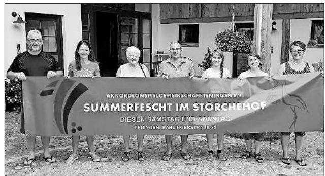
Die Verantwortlichen vom „Summerfescht“.

Für das leibliche Wohl bietet die ASG-Küche Leckeres vom Grill und Kaffee und Kuchen. Die Bevölkerung ist hierzu herzlich eingeladen!