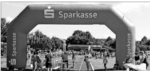
Viele Zuschauer beim Teningen 2. Sommerlauf.