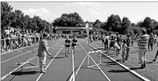
Prächtige Stimmung beim Zieleinlauf der Schüler/innen.

Sollte es für die Laufveranstaltung eine dritte Auflage geben, müssen die Veranstalter sicherlich noch am Konzept für den sportlichen Bereich feilen und das Laufangebot überdenken.