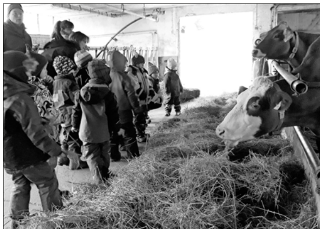
Die Kinder besichtigen den Kuhstall.

Dieses Mal durften die Kinder der Grashüpfer- und Waschbären-Gruppe zum ersten Mal den Hof mit all seinen Tieren kennenlernen und bestaunen. Als besonderes Highlight konnte ein erst wenige Stunden altes Kälbchen von den Kindern entdeckt werden. Aber auch die Fütterung der Ponys und Hühner und der Besuch im Kuhstall mit seinen Auslaufmöglichkeiten für die Tiere sorgten für viele Aha-Erlebnisse bei den Kindern. Der Waldkindergarten bedankt sich ganz herzlich beim Team des Schulbauernhofs!