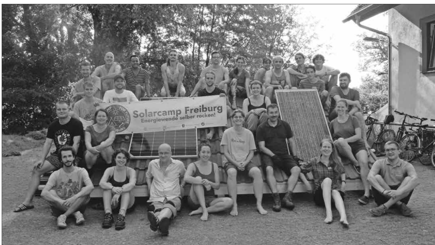
Die Teilnehmer beim Solarcamp, das auf dem Gelände der DLRG Nimburg-Teningen stattfand.

Weitere Informationen sind direkt auf der Webseite des Solarcamps zu finden: https://solarcamp-freiburg.de .