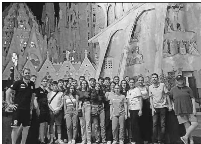
Die Teilnehmer beim Roadtrip-Abenteuer in Barcelona.

Das nächste Angebot von SpoFunnis wird das Hallenferienprogramm Sport&Fun in den Herbstferien am 30./31. Oktober sowie 2./3. November sein. Anmeldung ist möglich unter Telefon 07641 / 9379999 oder E-Mail: spuero@spofunnis.de. Weitere Infos zu den SpoFunnis sind auf der Homepage www.spofunnis.de zu finden.