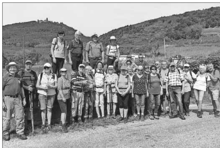
Die Wandergruppe bei St. Hippolyte; im Hintergrund die Hochkönigsburg.

Fördergesellschaft Forschung Tumorbologie Freiburg im Breisgau