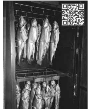
QR-Code für das Bestellformular.

Der ASV Teningen freut sich auf regen Besuch und über die Unterstützung und wünscht guten Appetit.