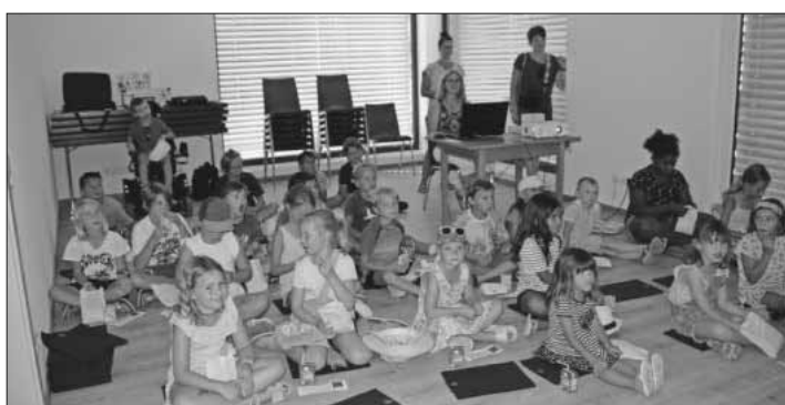
Als Abschluss der Ferienspielaktion fand eine Film- und Kamishibai-Vorführung statt.