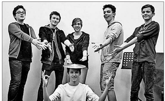
Mit Freude dabei.

Am Sonntag, 12. November , veranstaltet der Schlagzeugfachbereich der Musikschule Nördlicher Breisgau (Am Gaswerk 5 in Emmendingen) um 11 Uhr im Vortragssaal der Musikschule ein Vorspiel. Drumset, Percussion- und Malletinstrumente werden in kleineren und größeren Ensembles präsentiert. Interessierte Zuhörer sind herzlich willkommen - der Eintritt ist frei!