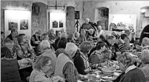
Bereits die vergangenen Jahre war der Mentonkeller gut gefüllt.