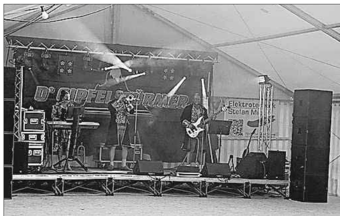
Die Gipfelstürmer sorgten beim Publikum für gute Laune.

burg musikalisch begleitete. Traditionell gab es im Anschluss Nudelsuppe mit Rindfleisch und Meerrettich. Auch an diesem Tag war wieder für beste Stimmung gesorgt: Am Sonntag spielten der Musikverein Riegel und die Feuerwehrkapelle Teningen auf, ebenso wie der Musikverein Holzhausen. Bei Kaffee und Kuchen konnte dann auch am Sonntag ein trockener Nachmittag genossen werden, während das Fest am Abend bei bestem Wetter und kalten Getränken ausklang.