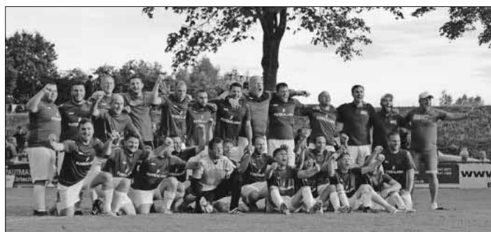
Die Sieger des 8. Köndringer Derbys ist die Süd-Mannschaft.