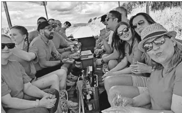
Beim diesjährigen Sommerausflug wurde eine Traktorfahrt mit Weinprobe in den Rebbergen von Köndringen unternommen.

Am vergangenen Samstag fand der Sommerausflug der Nimburger Felse-Trieber statt. Bei einer gemütlichen Traktorfahrt mit Weinprobe über die Rebberge von Köndringen konnte der Sommerausflug in vollen Zügen genossen werden. Nach der Traktorfahrt stärkten sich die Nimburger Felse-Trieber bei einem Vesper. Der Tag wurde anschließend auf dem Glotterfest in Nimburg abgerundet.