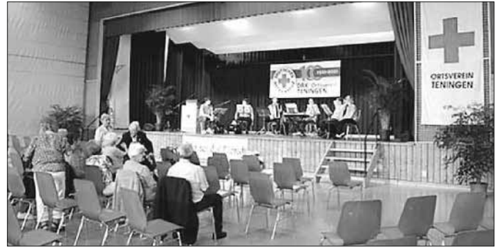
Die 100-jährige Geburtstagsfeier wurde durch die Akkordeonspielgesellschaft Teningen/Eichstetten eröffnet.