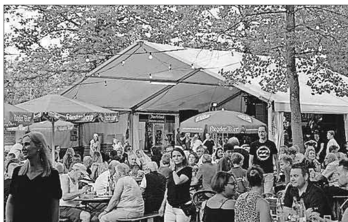
Das Glotterfest war nach zweijähriger Pause sehr gut besucht.