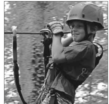
Kletterparcour für die Mutigen.

Am Samstag war dann Klettern im Abenteuerwald angesagt. Hierbei konnten die Teilnehmer der Größe