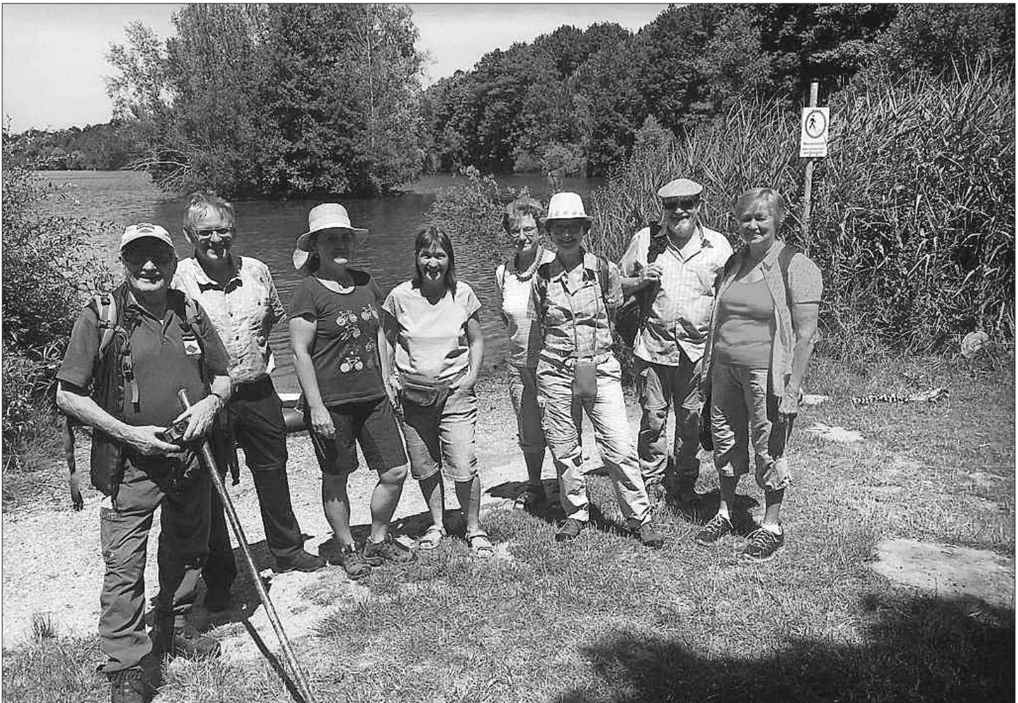
Die Wandersgruppe des Schwarzwaldvereins Teningen am Nimburger Baggersee.