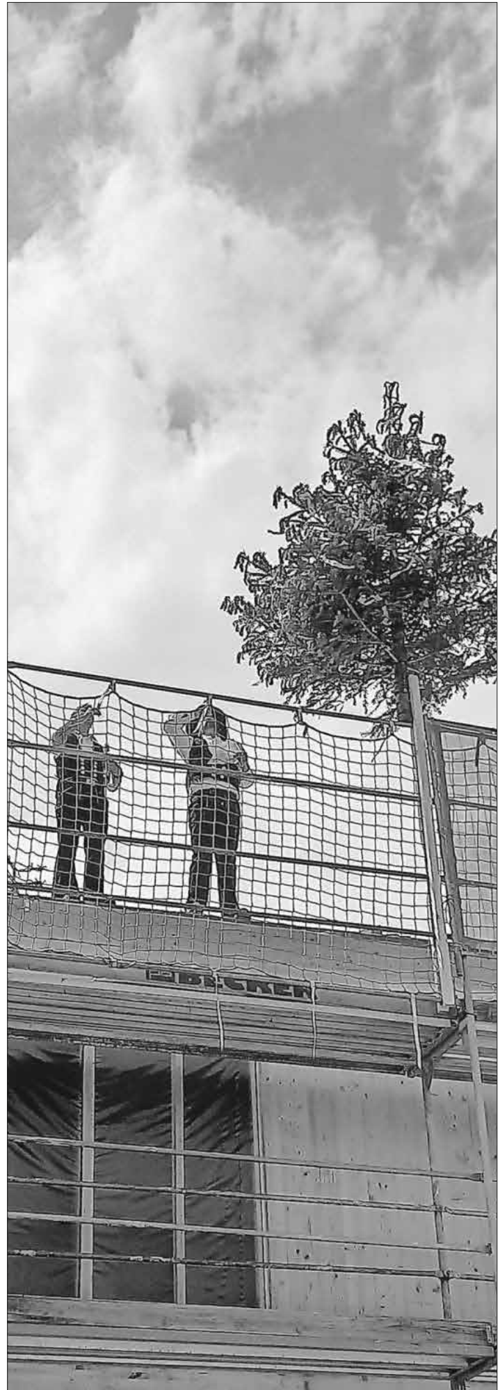
Richtspruch-(Baum) der Zimmermänner.