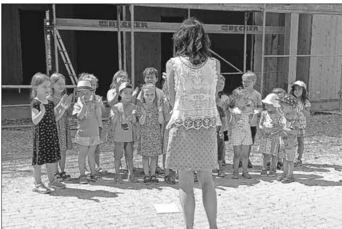
Begrüßungslieder durch Kinder des Kindergarten Regenbogen.

Nachdem der Kran den Richtbaum aufs Kindergarten-Dach gehoben hatte, wurde er von den Zimmerleuten gesichert. Zum Richtspruch stießen sie mehrmals an und wünschten den Kindern, ihren Familien und allen Beteiligten Glück und Schutz. Zum Ausklang an diesem heißen Sommertag gab es kühle Getränke und Schnitzel in Brot.