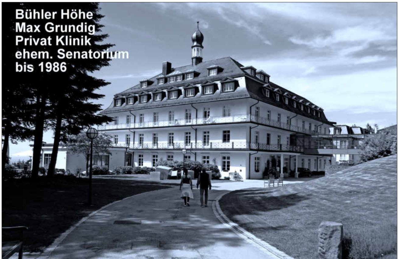
Bühlerhöhe: Max-Grundig-Privatklinik, ehemals Sanatorium (bis 1986).

Für die Wanderer war es nach dieser langen Entbehrungszeit ein schöner und erlebnisreicher Wandertag.