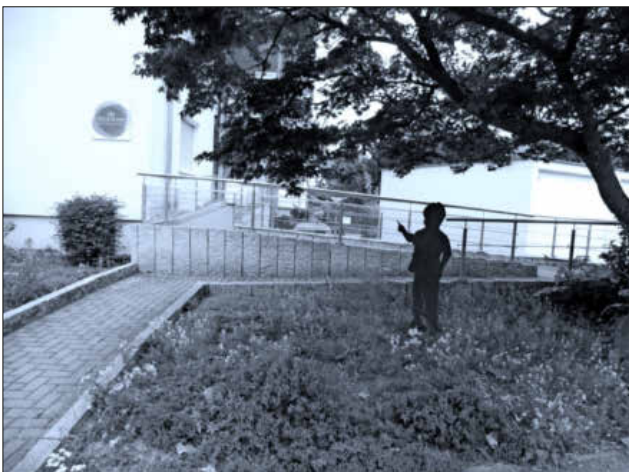
Die Kindertagesstätte Zeit.Raum.Kinder.