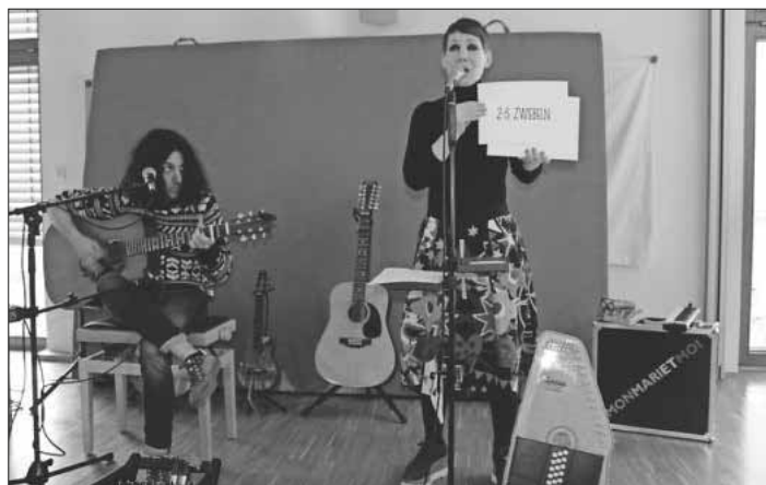
Ein praktisches Rezeptlied hatte das Duo „Mon Mari et Moi“ ebenfalls im Konzertrepertoire.