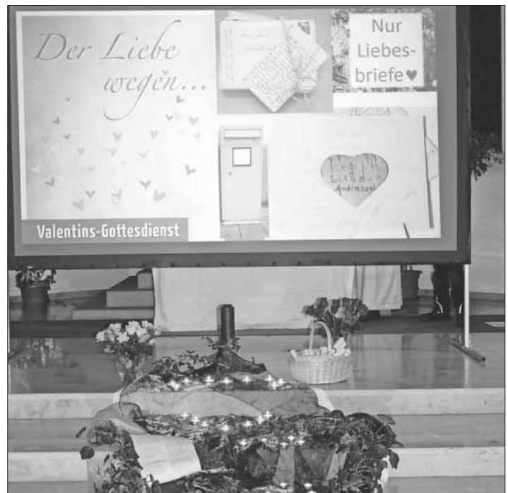
„Liebesbriefe“ waren das Thema beim ökumenischen Valentinsgottesdienst.

Die Band „Ein Funke“ aus Heimbach begleitete den Gottesdienst stimmungsvoll mit modernem Liedgut, unter anderem von den Carpenters. Eine gegenseitige Segnung der Anwesenden untereinander rundete die gelungene Gottesdienstfeier ab.