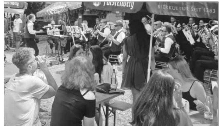
Gemütliches Beisammensitzen am Teningen Sonntag.