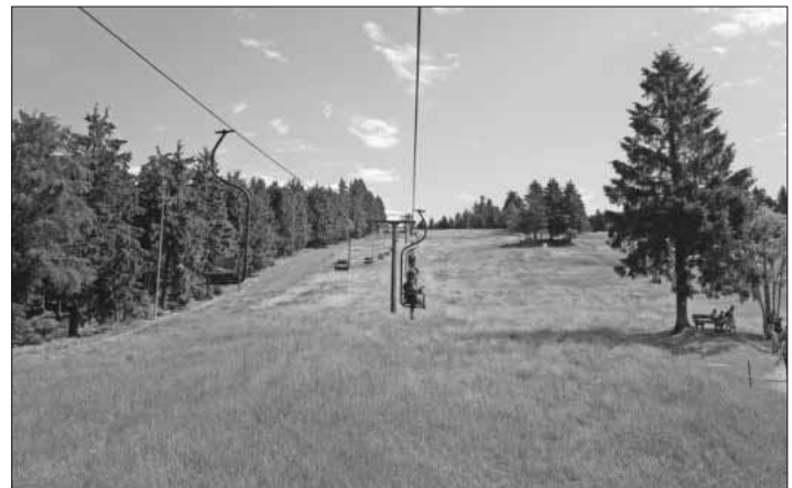
Die Gruppe im Sessellift.

bekannt gewesen sein. Nach so viel Wissensaneignung (sowie gehen und stehen) durfte das leiblich Wohl natürlich nicht fehlen. Auch hier bietet der Nationalpark eine äußerst ansprechende Lokalität mit Panoramablick. Vom Busunternehmer Bühler sicher kutschiert und vom KV perfekt organisiert, kehrten die Teilnehmenden gut gestimmt am frühen Abend nach Teningen zurück. Und wessen Neugier geweckt worden ist: Der Nationalpark ist sehr gut mit dem ÖPNV erreichbar.