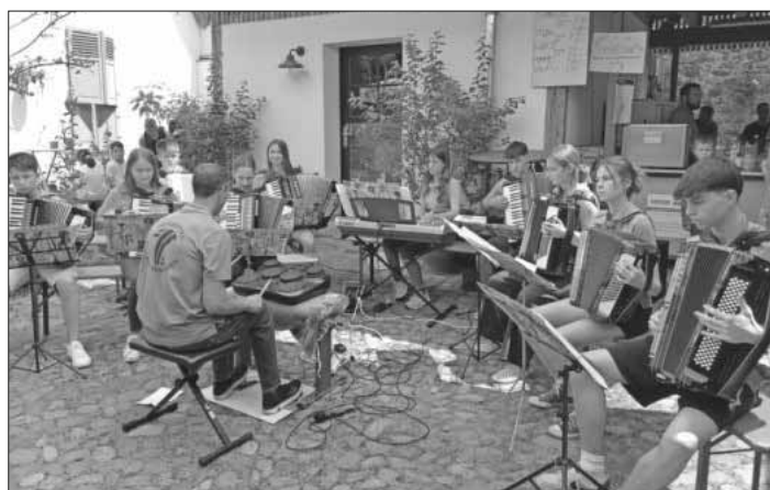
Die Vereinsjugend in Aktion