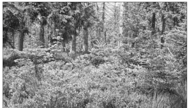
Blick in den Wald.