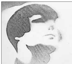
(Stencil/Fotografie von László Moholy-Nagy)

Die kleine Kunstausstellung School-art 5 im EG kann zu den regulären Öffnungszeiten sonntags von 14 bis 17 Uhr besichtigt werden.