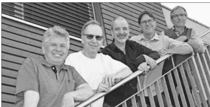
Die Band „ANDROMEDA“.