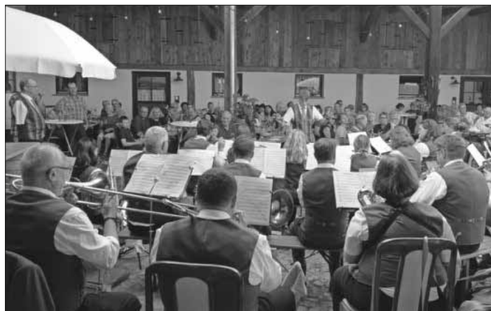
Die Musik- und Feuerwehrkapelle musiziert zum Abschluss des Sommerfests