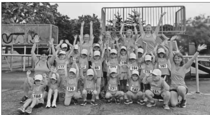
Die Lauffrekkinder beim Stadtlauf in Emmendingen.

Seit diesem Kindergartenjahr gibt es einen wöchentlichen Lauftreff der Villa Kinder. Mit viel Spaß, Elan, Ausdauer und Lauffreude haben sich die ca. 20 Kinder über Monate für den Stadtlauf in Emmendingen vorbereitet. Am Freitag, 30. Juni, war es dann endlich soweit. Die Laufgruppe hat sich auf dem Festplatz getroffen, um dann gemeinsam in die Stadt zu laufen. Nervös und voller Vorfreude warteten alle auf den Startschuss. Die 300 Meter-Runde war für die Kinder ein Klacks. Alle kamen glücklich im Ziel an. Die Erzieherinnen von der Villa Kunterbunt sind ganz stolz auf die tolle Leistung der Kinder.