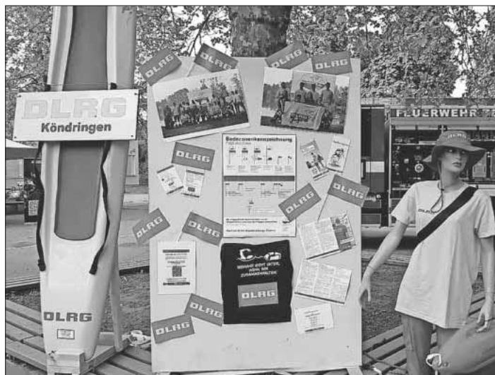
Informationsstand der DLRG-Ortsgruppe.

Weitere Infos auf der Homepage www.koendringen.dlrg.de und unter Telefon 07641/9598190 sowie auf dem Instagram-Account des DLRG Köndringen.