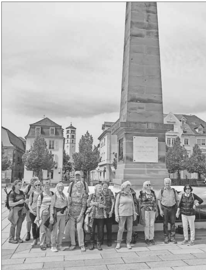
Die Gruppe freut sich über die gelungene Wanderung.