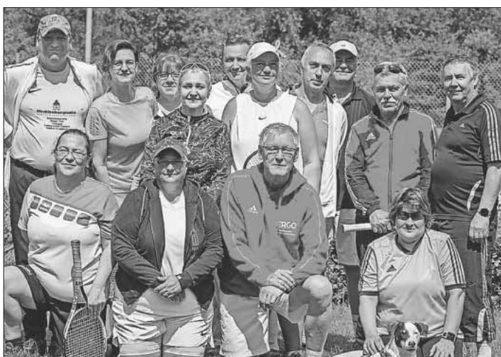
Die Teilnehmer starten in die Saison.