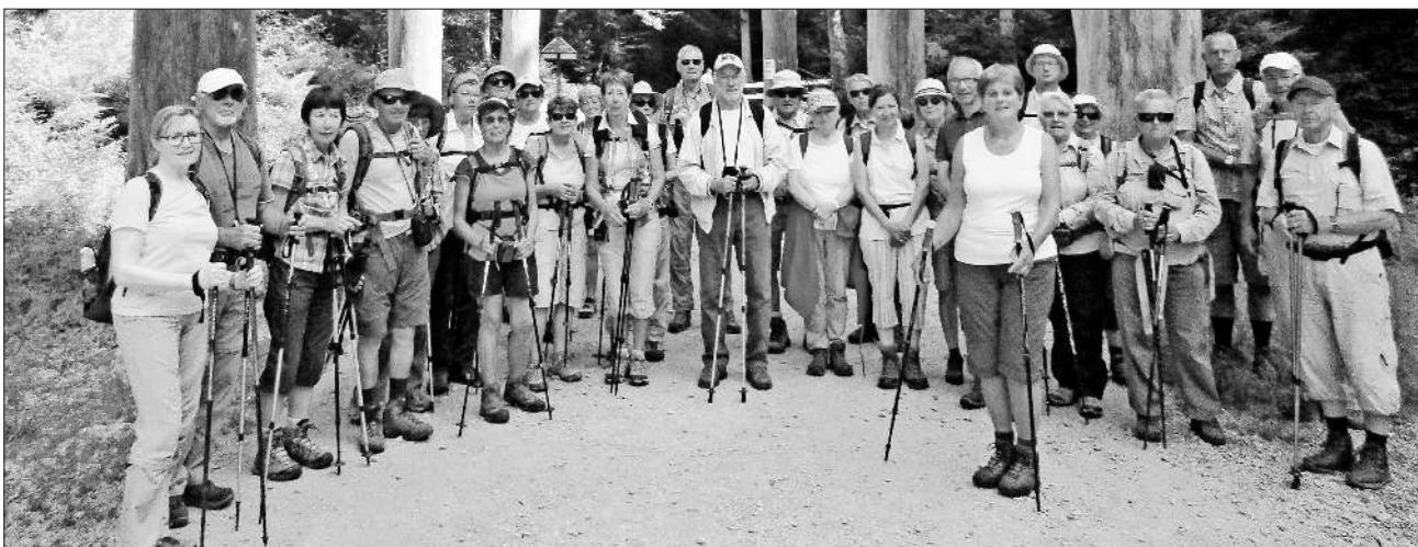
Die Wandergruppe bei den Allerheiligen-Wasserfällen.