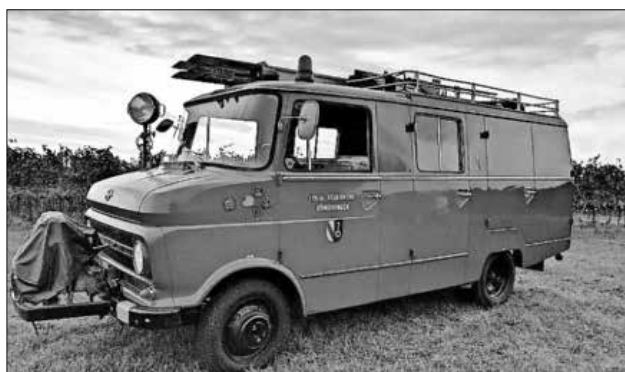
Das Oldtimer-Feuerwehrfahrzeug der Feuerwehr Teningen – Abteilung Köndringen.

Des Weiteren sucht die Abteilung Köndringen dringend einen Garagenunterstellplatz für das Oldtimer-Feuerwehrfahrzeug. Der Stellplatz sollte in Köndringen oder in der Umgebung sein. Er sollte unter der Woche und auch am Wochenende begehbar sein. Das Fahrzeug ist 2,2 Meter breit, 2,55 Meter hoch und 6 Meter lang. Wer selbst Platz hat oder jemanden kennt, der einen Platz zu vergeben hat, darf sich gerne unter Telefon 0162 / 1024170 melden.