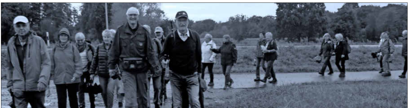
Ein Teil der Wandergruppe.