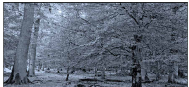
Die Flatterulme im Verbund mit der Stieleiche und der Hainbuche.

Am beeindruckenden Waldtrauf entlang des Geisbaches wanderte man schließlich wieder zur Bahlinger Straße und dann durch die Feldflur über den Herzlachenweg zurück zum Ausgangspunkt der Wanderung an das Kiosk am Nimburger Baggersee. Sieben Kilometer Wanderstrecke in 2,5 Stunden waren bewältigt. Bei einem Vesper dort ließen die Wanderer nochmals das beeindruckende Geschehen Revue passieren.