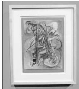
Originalbild von Hilla von Rebay.

Sturm-Frauen. Künstlerinnen der Avantgarde in Berlin 1910–1932