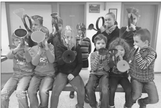
Stolz werden die Schlauchtrompeten präsentiert

Das Erlernte konnten die Kinder gleich am Kinderumzug ihren Eltern und allen Zuschauern vorführen, unterstützt vom Spielmanns- und Musikzug, der sich in diesem Jahr als „Schneemannszug“ präsentierte. Verkleidet als Schneemänner und natürlich auch Schneefrauen wurden standesgemäß Eisbonbons und kleine süße Schneebälle verteilt, während das neue Trompeten-Register die Musikerinnen und Musiker kräftig unterstützte.