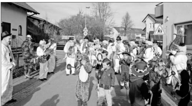
Der „Schneemannszug“ mit dem neuen Trompeten-Register