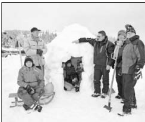
Iglubau und Schlittenfahren 2015 auf dem Kandel.

Der Schwarzwaldverein bietet am Samstag, 27. Februar, ein Erlebnistag unter dem Motto „Spaß und Spiel im Schnee“ für Kinder und Eltern, Enkel und Großeltern an. Wer sich im Schnee mal richtig austoben möchte, hat auf dem Kandel die besten Möglichkeiten dazu. Ein Iglubau ist bei entsprechenden Schneeverhältnissen vorgesehen. Treffpunkt zur gemeinsamen Abfahrt und für diejenigen,