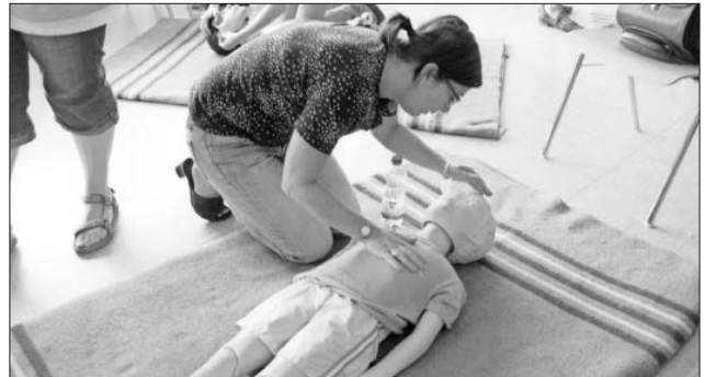
Im Kurs wird unter anderem die Herz-Lungen-Wiederbelebung bei Kleinkindern geübt.

Das Kursangebot bietet Eltern, Großeltern, Erzieherinnen/Erzieher, Tagesmüttern, Babysitter und allen anderen Personen, die Kinder betreuen, die Möglichkeit, sich auf den Umgang mit solchen Unfallsituationen vorzubereiten und Ängste abzubauen. Lehrgangsort: Teningen, DRK, Neudorfstraße 40, Schulungsraum, viermal dienstags, 19.30 bis 22 Uhr. Beginn: 1. März. Anmeldung: 07641 / 9225-25.