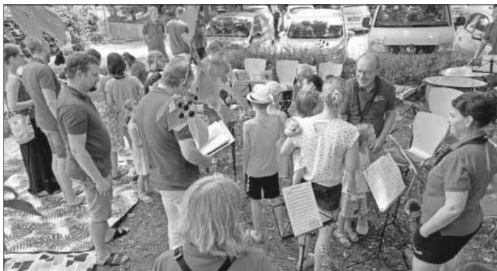
In der Pause mischten sich die jungen Gäste unter die Musiker.