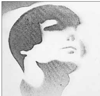
Stencil/Fotografie von László Moholy-Nagy.

Die kleine Kunstaustellung „School-art 5“ im Erdgeschoss kann zu den regulären Öffnungszeiten sonntags von 14 bis 17 Uhr besichtigt werden.