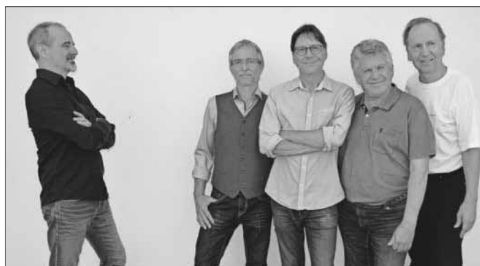
Die Band Andromeda.

Für kühle Getränke sorgt der Burgverein Landeck. Der Eintritt ist frei – Spenden sind willkommen. Eigene Sitzgelegenheiten können mitgebracht werden. Bei Regen findet die Veranstaltung im Gemeindesaal an der Burg statt.