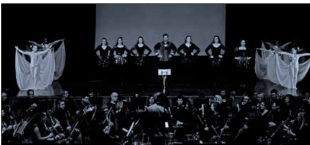
Die Winzerkapelle zusammen mit dem Elztäler Ballettverein beim „Concerto Grandioso“ im Jahr 2016.

Wurde das Interesse geweckt? Es folgen in den nächsten Wochen ganz besondere Konzertereignisse, die alle zurückführen zu ganz besonderen Konzerten. Die Musikerinnen und Musiker wünschen allen viel Spaß beim Konzertereignis „at home“. Die Winzerkapelle hofft, dass man sich gesund beim nächsten Konzert wiedersehen wird.