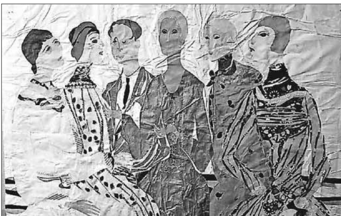
Hilla von Rebay, „Les Serieuses“, Collage 30-er Jahre

Von 16 bis 18 Uhr ist die Ausstellung für alle Interessierten geöffnet. Konstanze von Rebay wird durch den Nachmittag führen. Ab 25. September ist das Rebay-Haus wieder jeden Sonntag von 14 bis 17 Uhr geöffnet.