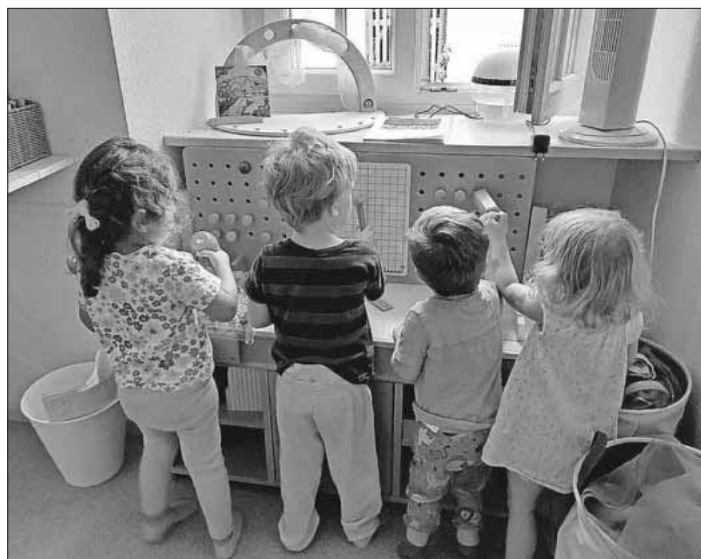
Die Kinder haben viel Spaß und Freude mit der neuen Werkbank.

Ein herzliches Dankeschön nochmal an die Firma Beny Transporte, so kann schon den Jüngsten das Handwerkeln nähergebracht werden.