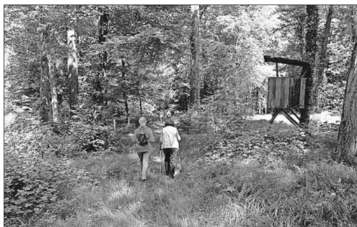
Genusswandern in der Teninger Allmend - fit werden in freier Natur.

Gesundheitswanderführer Kurt Armbruster hilft dabei, sanft in Bewegung zu kommen und zu bleiben und macht dauerhaft fit. Er kombiniert kurze Wanderungen mit Übungen für Körper, Geist und Seele. Das Bewegungsprogramm des Deutschen Roten Kreuzes wirkt nachgewiesen positiv auf verschiedene Bereiche der Gesundheit und ist ganz bewusst auch für Wander(wieder)einsteigerinnen und -einsteiger geeignet. Gesundheitswandern ist eine spezielle Form des Wanderns – für alle zum Ausprobieren. Um Anmeldung unter Telefon 07641 / 92250 oder E-Mail info@vhs-em.de wird gebeten, da die Teilnehmerzahl begrenzt ist.