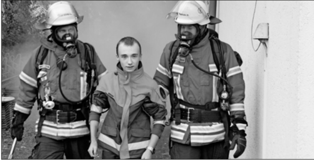
Die Jugendfeuerwehr stellte sich als verletzte Personen zur Verfügung.