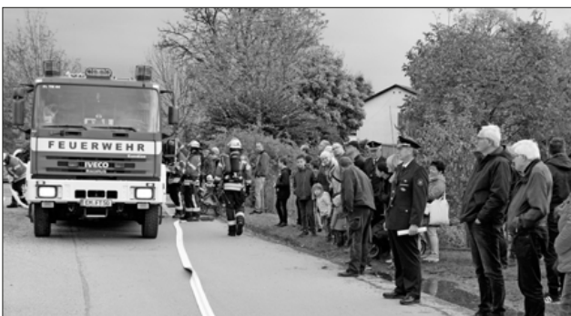
Zahlreiche Übungsbeobachter verfolgten das Spektakel.