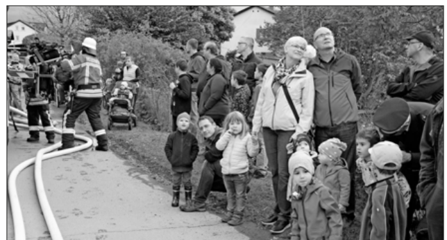
Auch für die Kinder war die Übung spannend.