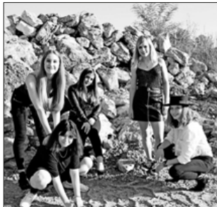
„Der gemeinsame Spaß und die Freude sind das Wichtigste.“

Selbstsicher, ausdrucksstark, originell und mit Freude posierten die Mädchen schließlich in ihren ausgewählten Outfits vor der Kamera. Durch gemeinsame Fotos wurden dabei auch das Gruppengefühl und der Zusammenhalt gestärkt. Die jün-