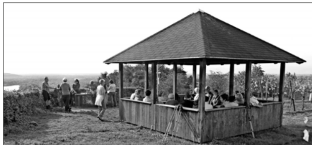
Die Teilnehmer bei einer gemütlichen Einkehr mit Blick über den Rhein.

Der Rückweg nach Sasbach führte entlang des Rheins und der Rheinauen mit dem Altrheingewässer, welche eine ökologische Bedeutung haben. Nach einer gemütlichen Einkehr ging es mit der Kaiserstuhlbahn wieder heimwärts.