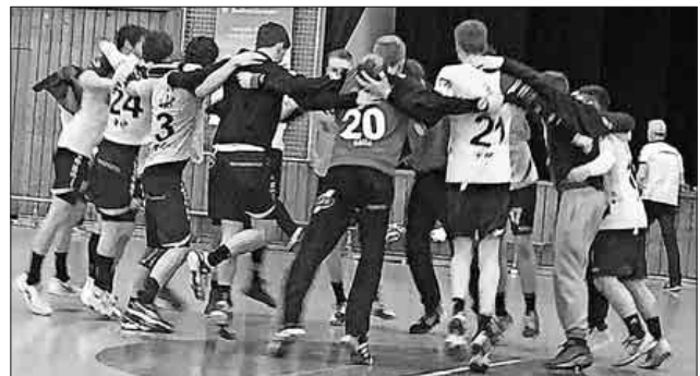
Freude über das Ergebnis.