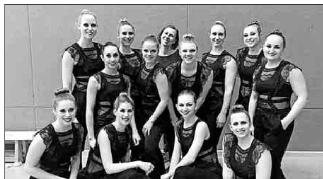
Die Regionalliga-Wettkampfgruppe „Effect“ des TSC Teningen des Jahres 2018.

Terminankündigung: Generalversammlung am kommenden Samstag, 3. März.