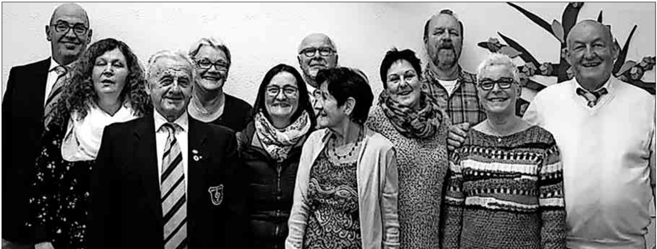
Die neu gewählte Vorstandschaft.