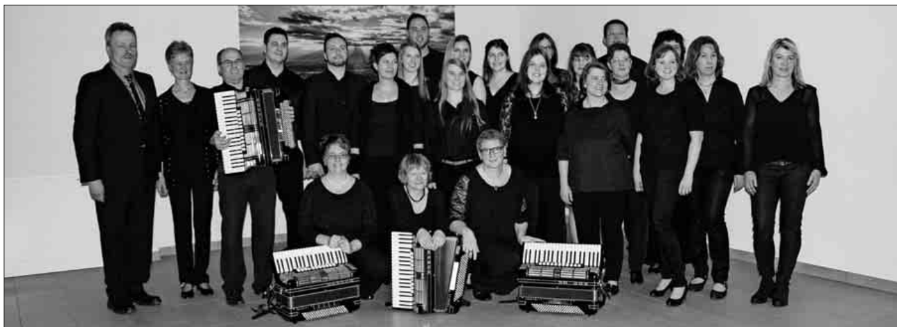
Die ASG freut sich auf seine Konzertbesucher.

Die ASG freut sich auf zahlreichen Besuch.