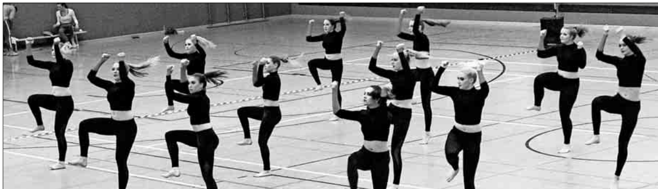
„Jazz à Nova setzt die Musik präzise in Szene.

Wichtig für alle Fans des Jazz- und Modern Dance: Das letzte Turnier der Saison 2018 findet am 9. Juni als Heimspiel für alle Gruppen in der Ludwig-Jahn-Halle in Teningen statt. Dieses Turnier verspricht besonders interessant zu werden, da beim Saisonfinale üblicherweise über Aufstieg und Abstieg entschieden wird. Die Turnierdaten der Saison 2018 und detaillierte Ergebnisse sind unter http://www.tanzsport.de/de/sportwelt/jazz-und-modern-dance/ligabereiche zu finden.