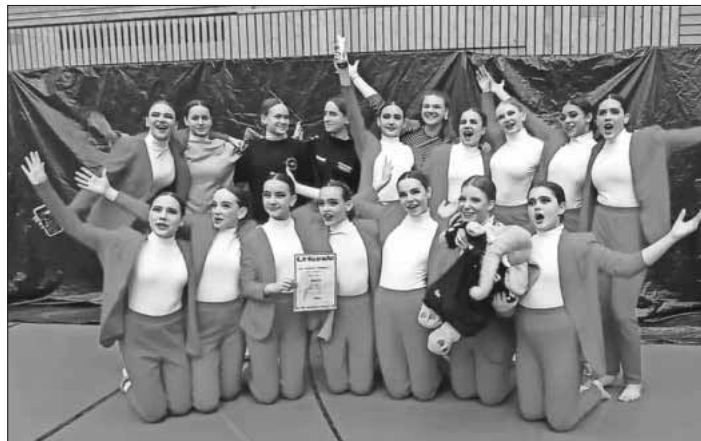
Die Formation Joukko des TSC Teningen.

Zusätzlich zu den Saisonturnieren in der Jugendverbandsliga läuft die Vorbereitung der Jugend-Smallgroupformation von Joukko aufgrund der Qualifikation in 2022 für die IDO Europameisterschaft in Kielce, Polen, am 22. Juni 2023. Für diesen besonderen internationalen Wettkampf hofft Joukko auf Sponsoren, die die Nachwuchstalente des TSC Teningen finanziell unterstützen möchten. Bei Interesse kann der TSC Teningen leicht über seine Kontakt-E-Mail-Adresse auf der Homepage des Vereins erreicht werden.