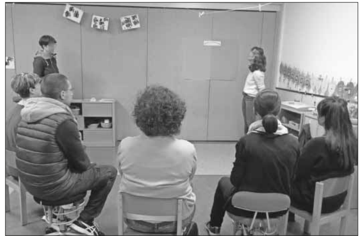
Eine der Kleingruppen des Workshop-Elternabends.