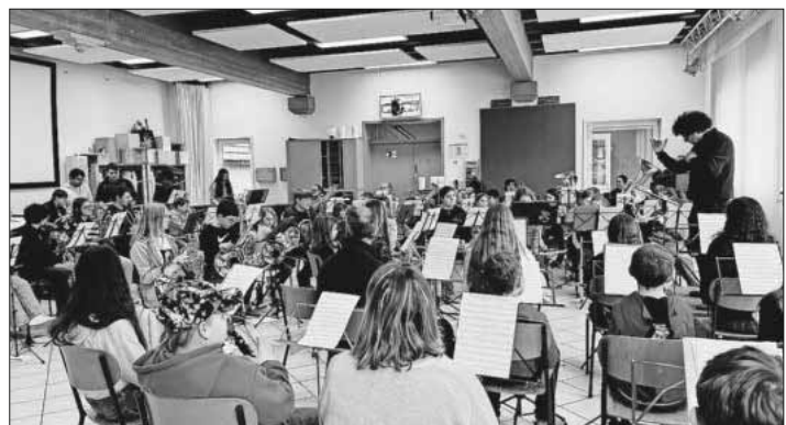
Das Jugendorchester während einer Gesamtprobe.

Interessierte Kinder, Jugendliche und jung gebliebene Erwachsene, die ein Instrument spielen oder eines lernen möchten, dürfen sich gerne beim Jugendleiter der Bläserjugend unter jugend@winzerkapelle.de oder 07641 / 954832 melden.