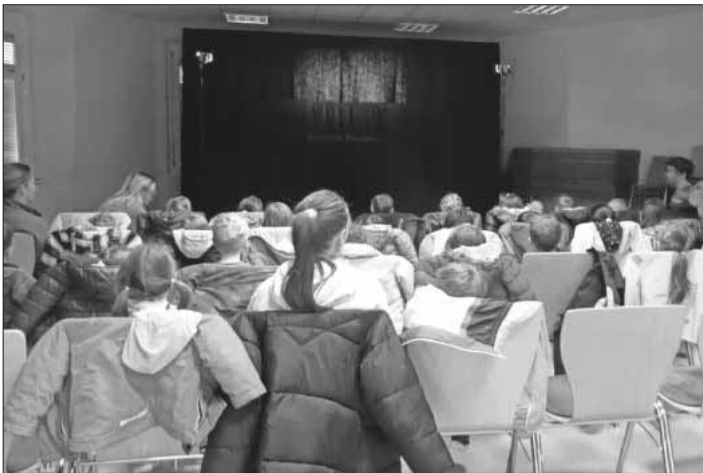
Die Freiburger Puppenbühne spielte für die Kinder.