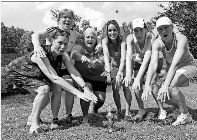
Meister: Damen 30

Die weiteren Ergebnisse: Herren 40/1 – TC Schallstadt/Wolfenweiler 1:8; Herren 60 – TC Freistett 1:8; Juniorinnen W16 – TC Hartheim 2:4.