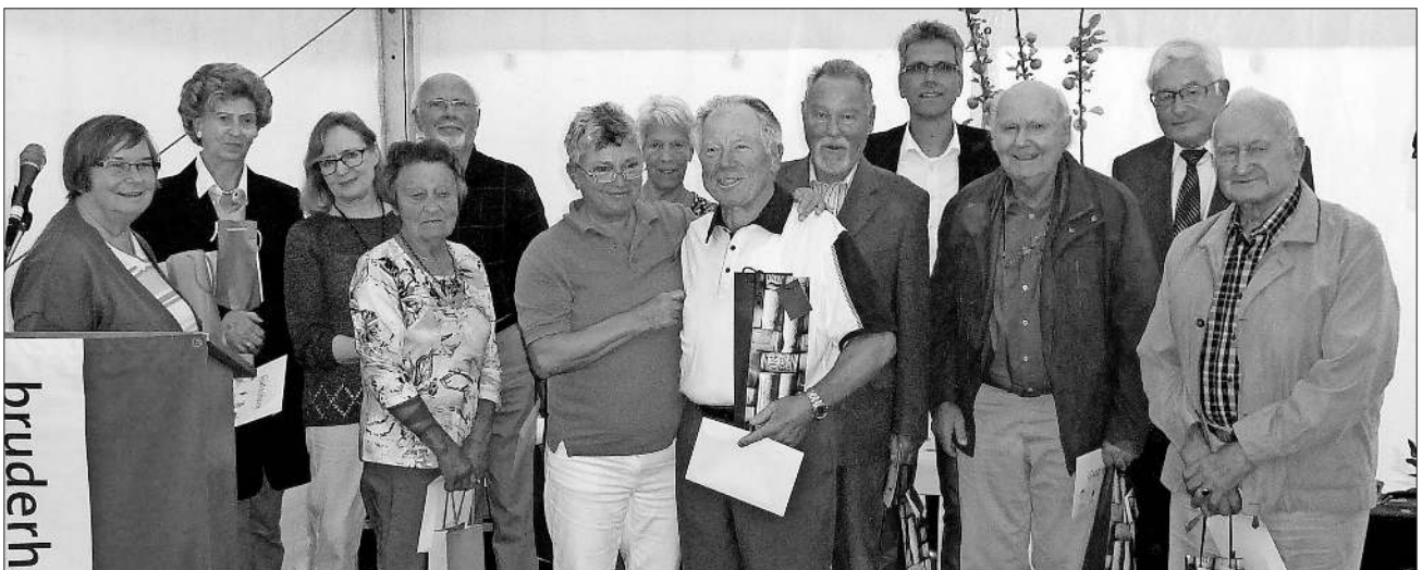
Seit Eröffnung des Seniorenzentrums helfen diese Männer und Frauen ehrenamtlich.