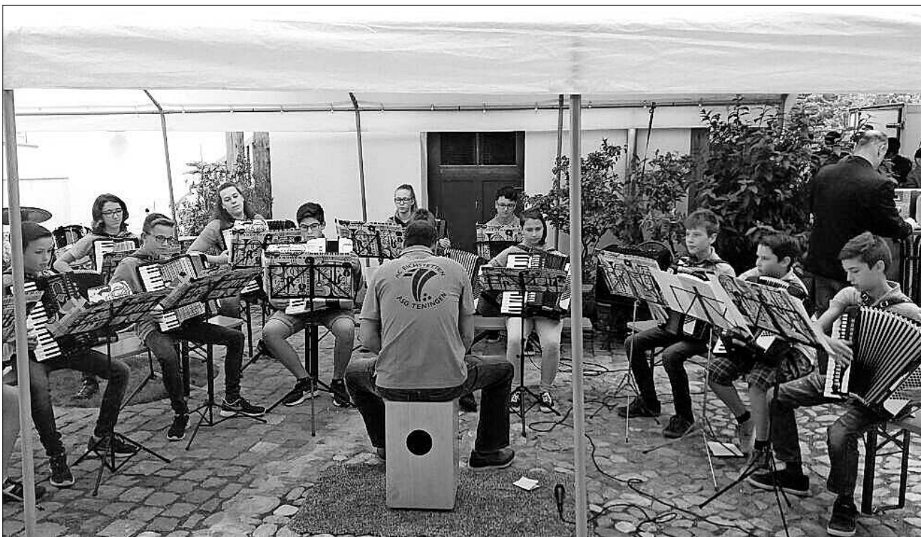
Am Sonntagnachmittag begeisterte das Akkordeon-Schülerorchester Teningen/Eichstetten mit flotten Melodien.

Alles in allem eine rundum gelungene Veranstaltung, die sicherlich ihre Wiederholung finden wird – dann mit hoffentlich sommerlicherem Wetter!