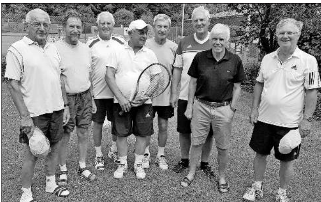
Meister: Herren 70