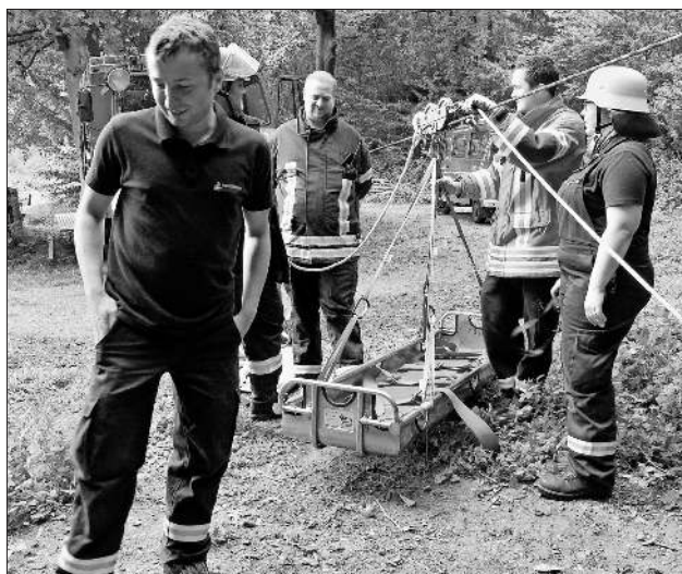
Hier wurde die Rettung aus unwegsamem Gelände simuliert.

die Beschäftigung und das praxisbezogene Wissen mit den Messgeräten aus dem Bereich Gefahrgut. Hier sollten Windgeschwindigkeit und die Windrichtung bestimmende und mithilfe von Prüfstäbchen Chemikalien und chemische Gase analysiert werden. Eine praxisnahe Erstmaßnahme bei Gefahrgutunfällen. Praxisnah war auch der Umgang mit der Gerätschaft des Gefahrgutfahrzeuges, um auslaufende gefährliche oder umweltschädigende Flüssigkeiten aufzufangen oder umzupumpen.