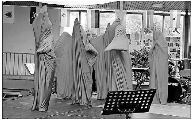
Tanzaufführung der Schüler in Tanzsäcken.

Am vergangenen Sonntag wurden im Rahmen des LBZ-Sommerfestes die Tänze und die Löwenjagd gemeinsam aufgeführt. Das Besondere an den Tänzen war, dass die Kinder in Tanzsäcken versteckt waren und zu aktuellen Hits wie „Ain't your mama“, „Chöre“ und „Shape of you“ tanzten.