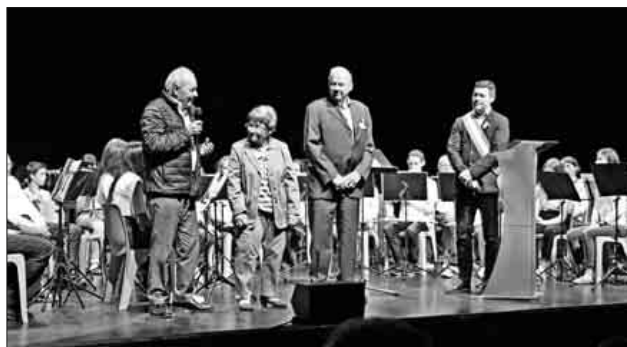
Das Partnerschaftskomitee erzählt von 35 Jahren Jumelage zwischen Teningen und La Ravoire und sagt „Danke“.