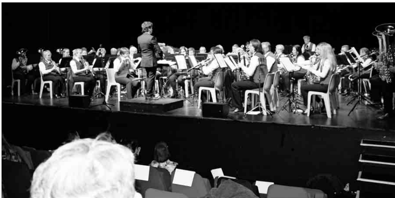
Im Rahmen des Jubiläums spielte die Winzerkapelle Köndringen ein Konzert in La Ravoire.