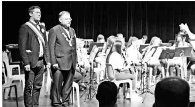
Bürgermeister Bret und Bürgermeister Hagenacker zu den Nationalhymnen.

Auch in Teningen wird es in diesem Jahr ein großes Jubiläumswochenende anlässlich der 35-jährigen Jumelage geben. Dieses findet vom 13. bis 15. September statt. Die Planungen und Organisation sind bereits jetzt in vollem Gange. Um es mit den Worten von Bürgermeister Hagenacker zu sagen: „Der Dank ist die höchste Form der Bitte.“, denn für das Jubiläumswochenende sind das Partnerschaftskomitee sowie die Gemeinde auf Hilfe und Unterstützung in vielfältiger Weise angewiesen, beispielsweise in Form von Übernachtungsmöglichkeiten für die anreisenden Gäste.