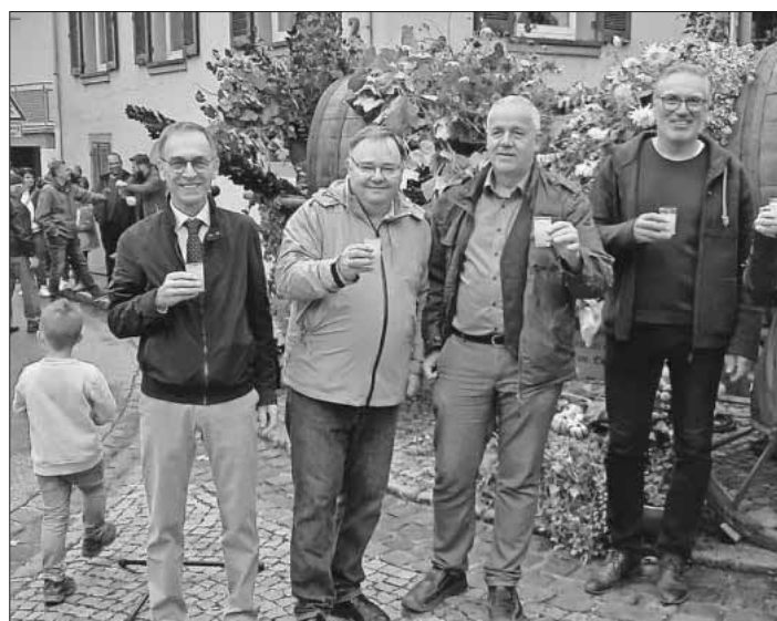
Die offizielle Eröffnung der Kilwi.