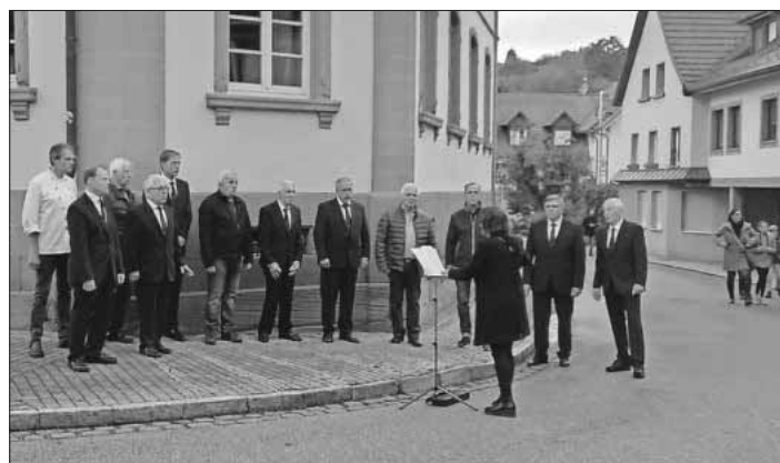
Der Männerchor Heimbach umrahmt die Eröffnung musikalisch.