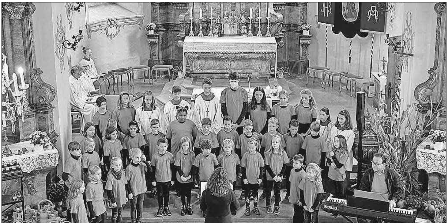
Der Kids- und Teens-Chor St. Gallus

Als Abschluss des offiziellen Teils erhielten die Kids und Teens ein kleines Präsent. Danach ließen die Anwesenden die Versammlung beim Erntedankessen ausklingen.