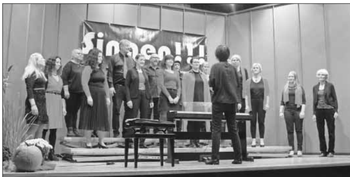
Der Gastchor SwiPoGos.