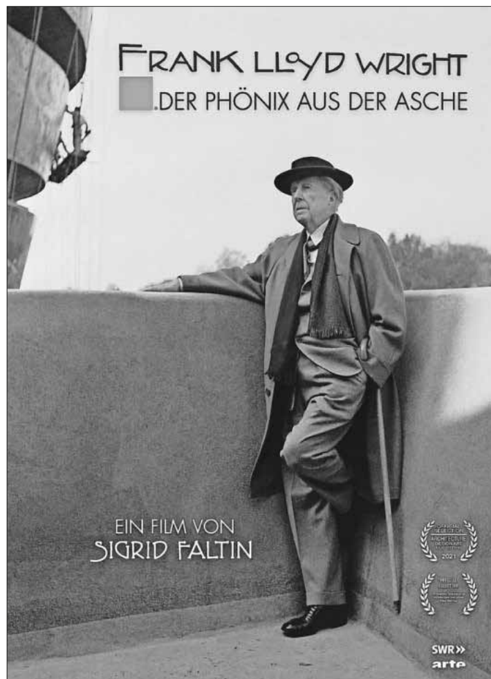
Frank Lloyd Wright.