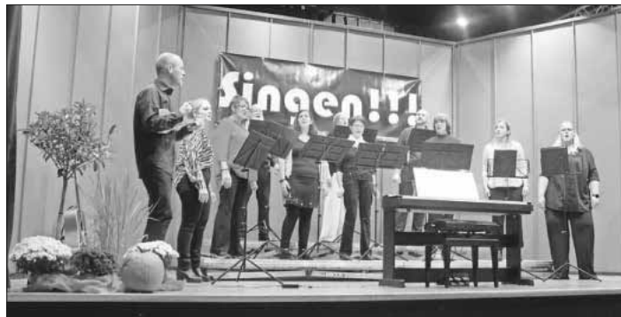
Der Köndringer Chor Quintessenz.