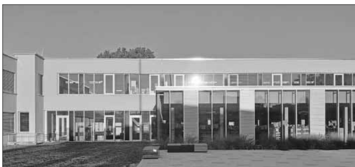
Die Schule im ersten Sonnenlicht.

Auch für das leibliche Wohl ist gesorgt. Die Schülerinnen und Schüler freuen sich über reges Interesse.