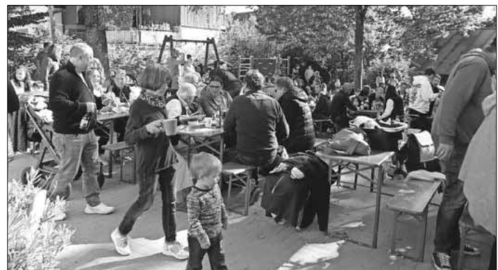
Die Besucher beim gemütlichen Kuchenbüfett.

Da es ein Kindergartenfest war, gab es natürlich für diese auch eine Spielstraße mit ganz unterschiedlichen Angeboten. Zum Schluss war man sich einig, dass es ein schönes Fest war.