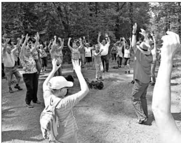
Lockerungsübungen in der Teningen Allmend.

Das „Gesundheitswandern“ des DRK-Ortsvereins Teningen erfreut sich einer großen und steigenden Beliebtheit. Gerade jetzt laden die Frühlingstemperaturen zu ausgedehnten Touren ein. Das Programm richtet sich nach den Bedürfnissen der Teilnehmer. Die physiotherapeutischen Übungen stärken die Leistungsfähigkeit und tragen dazu bei, die körperliche und geistige Mobilität zu erhalten. Das Teningen Rote Kreuz bietet in Kooperation mit der VHS ab Dienstag, 10. April, fünfmal dienstags von 10 bis 12 Uhr Gesundheitswanderungen an. Anmeldung unter Telefon 07641 / 92250, Treffpunkt Parkplatz Trimm-dich-Pfad, Teningen Allmend.