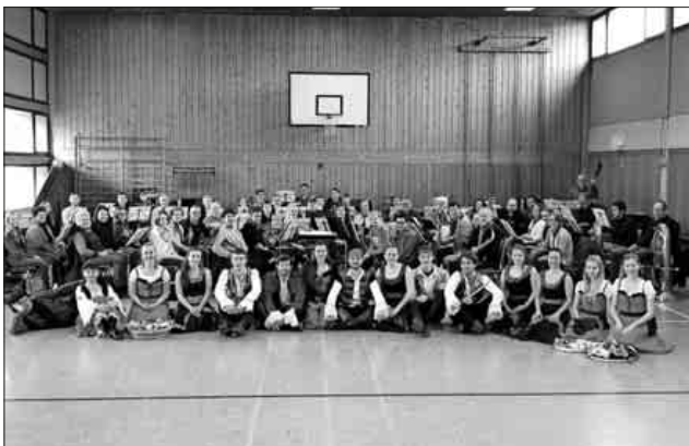
Generalprobe für die bevorstehenden Konzerte in Chile.

Eine Reise, die in keinem Reisekatalog zu buchen ist und viele tolle Eindrücke und Erinnerungen mit sich bringen wird. Die Musikerinnen und Musiker werden einige Eindrücke und Bilder über das Internet veröffentlichen.