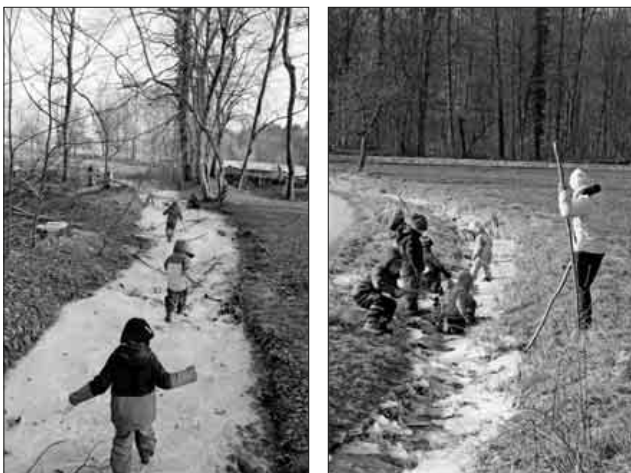
Die Kinder hatten viel Spaß auf dem zugefrorenen Bach.