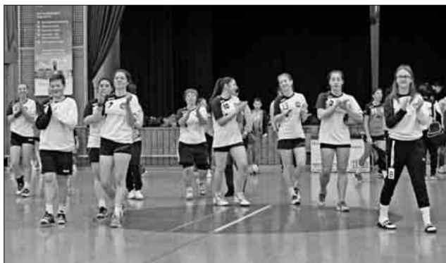
Die A- Mädchen holten sich den 3. Tabellenplatz zurück