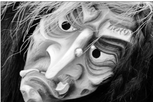
Auch allerlei Hexen ...