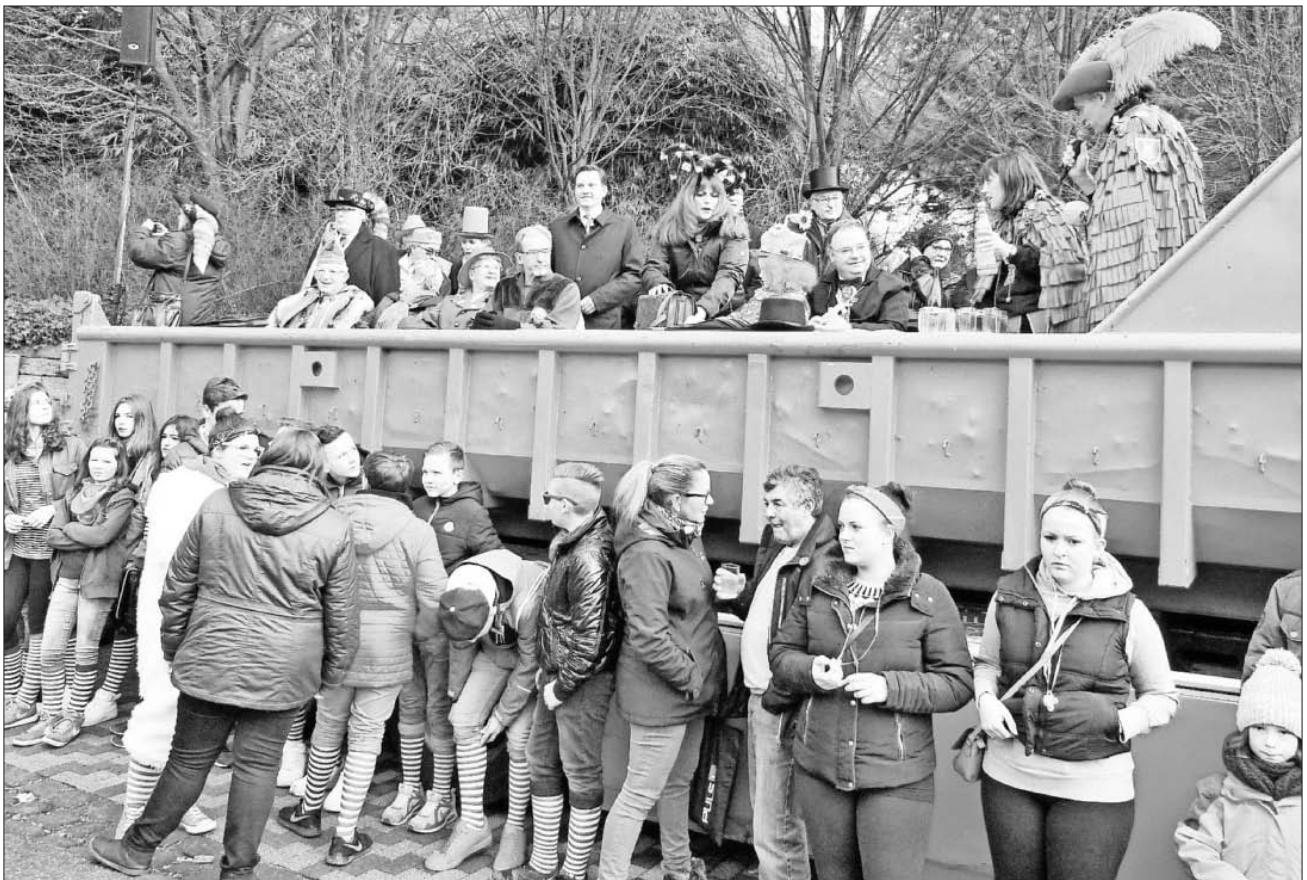
Auch die Ehrengäste hatten ihren Spaß am Jubiläumsumzug.