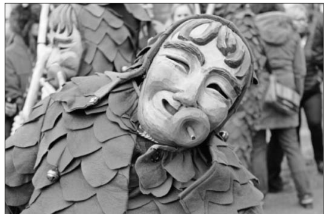
... und gemütliche Gesellen waren dabei