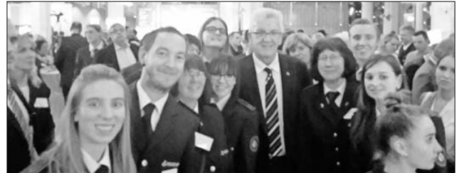
Ministerpräsident Winfried Kretschmann im Kreise der Köndringer Delegation.

Danach ergab sich die Chance, mit dem Landesvater zu reden, und er gab sich gewohnt herzlich, sodass er auch gerne für ein Foto zur Verfügung stand, nicht ohne der Gruppe noch ein „Danke schön für ihre hervorragende Arbeit“ zu sagen.