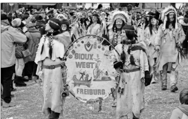
Sioux West Freiburg