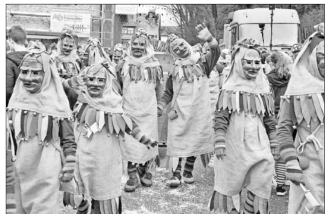
Die Kindringer Ruäbsäck stellten mit 223 Teilnehmern die größte Gruppe.