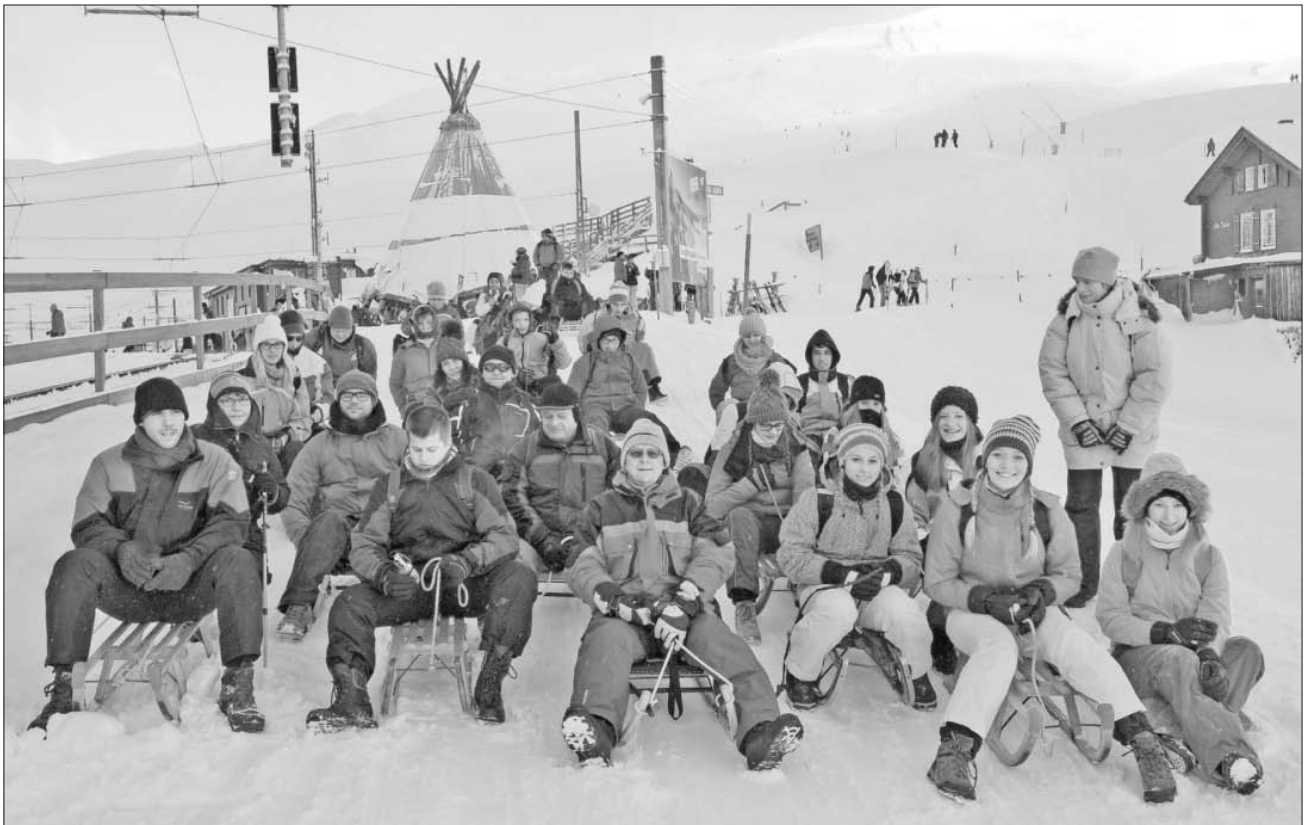
Es kann losgehen, Startaufstellung auf der kleinen Scheidegg.

tenpiste der Welt hat trotzdem noch genügend Adrenalinschub zu bieten. Schließlich geht es 1.000 Höhenmeter nach unten. Zwischenstationen nach unten und die Zahnradbahn nach oben bieten die notwendigen Verschnaufpausen. Aufgrund des Weltcuprennens im benachbarten Wengen war auch wieder die Kunstflugstaffel der schweizerischen Luftwaffe pünktlich zur Stelle. Dieses Mal in der Formation sogar mit einem zusätzlichen Airbus-Verkehrsflugzeug. Sonnenschein und Schneefall haben sich abgewechselt. Was will man im Winter mehr. Allen hat es Spaß gemacht und sind gegen Abend wohlbehalten wieder in Köndringen angekommen. Vielen Dank an den Busfahrer Bernhard Bühler und die Organisatoren Sabrina und Hermann Rieth.