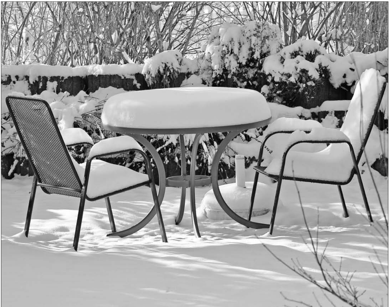
Erst wenige Tage her ...