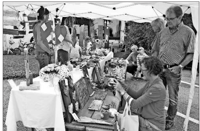
Selbstgemachtes und Gebasteltes füllten den Marktstand

Eine sehr gelungene Aktion des Elternbeirates, deren Erlös direkt der Kindergartenarbeit zur Verfügung steht.