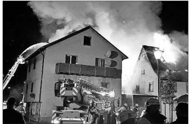
Beim Eintreffen der Feuerwehr stand bereits alles in Flammen.