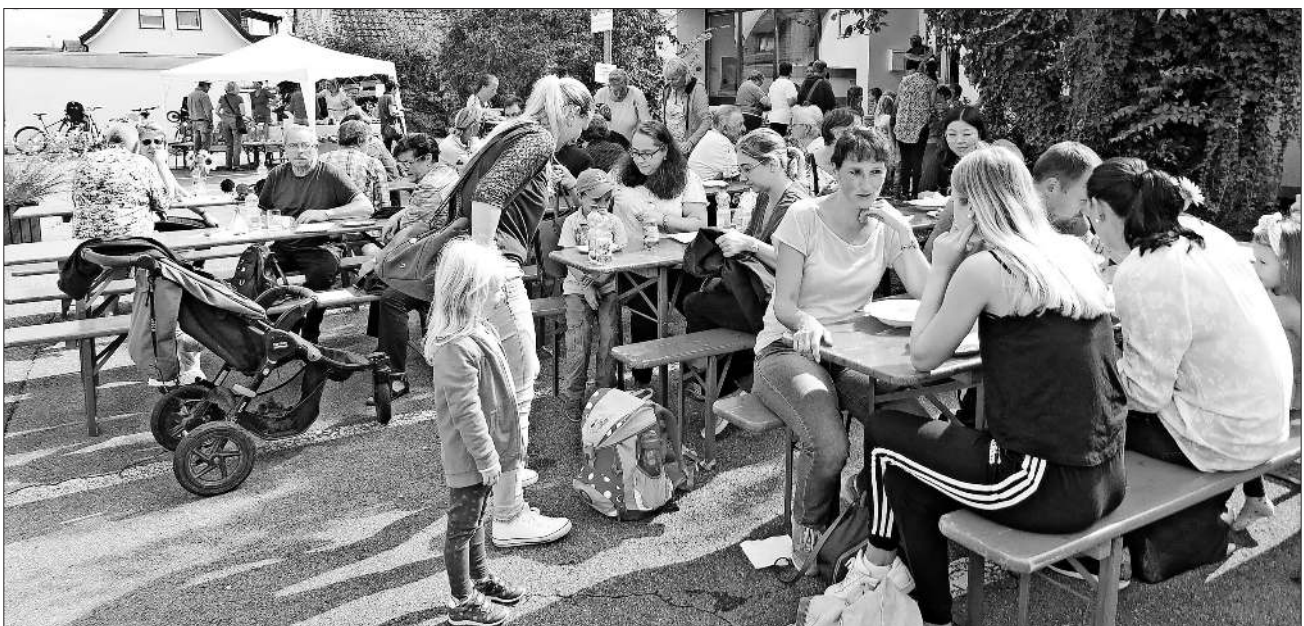
Der Herbstmarkt des Kindergartens war gut besucht.