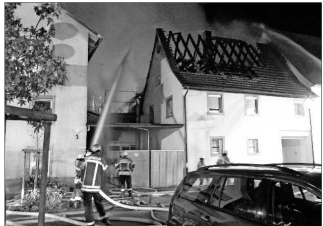
Von allen Seiten wurde der Brand bekämpft.

werden konnten. Er war sehr beeindruckt, mit welcher spontanen Hilfsbereitschaft sich die Nachbarn um die betroffenen Personen kümmerten.