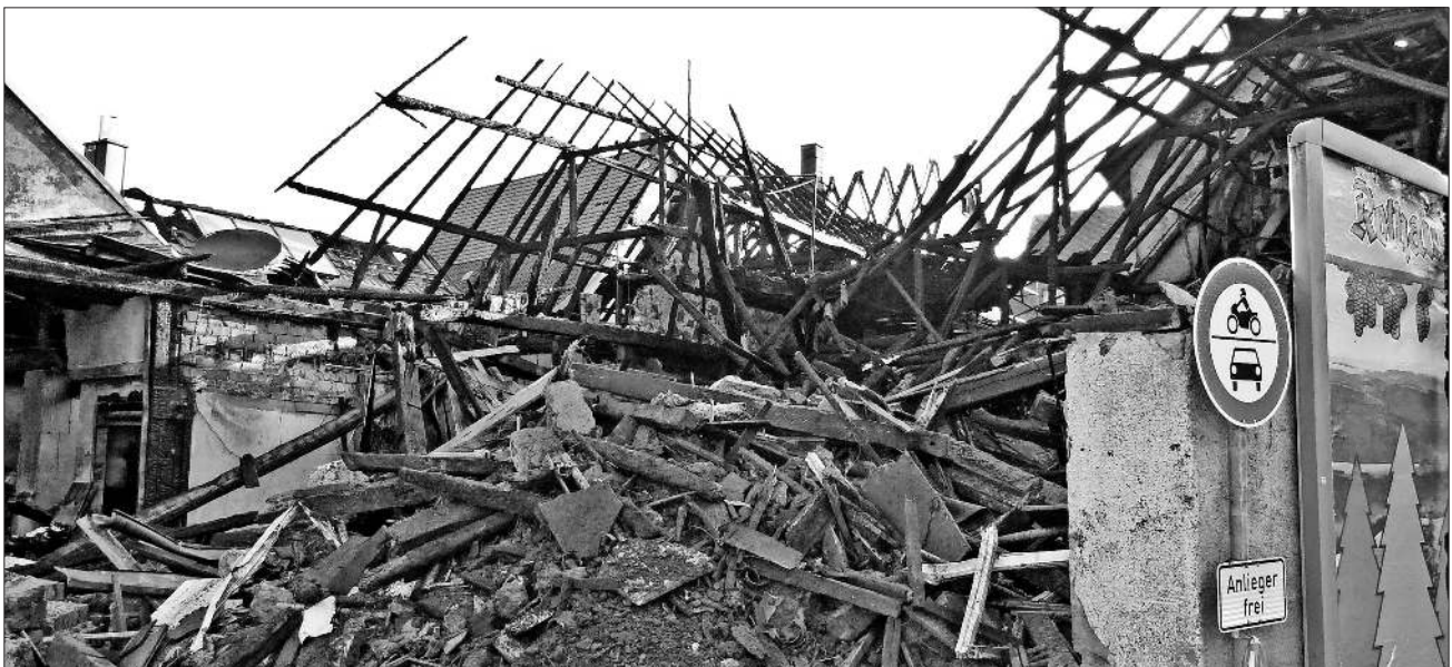
Am Tag darauf war das ganze Ausmaß der Schäden ersichtlich.

werden konnten. Er war sehr beeindruckt, mit welcher spontanen Hilfsbereitschaft sich die Nachbarn um die betroffenen Personen kümmerten.