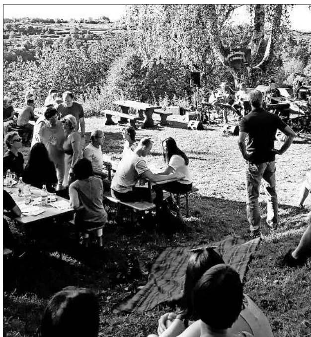
Kulisse am Heimbacher Waldparkplatz