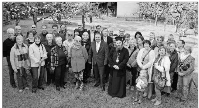
Die Teilnehmer der diesjährigen Veranstaltungsreihe Tag der offenen Gartentür mit Landrat Hanno Hurth und Bürgermeister Hagenacker, der seinen Besuch aus Griechenland mitgebracht hatte.

Für die Öffentlichkeit ist der Garten und das Museum am Sonntag, 5. Juni, von 11 bis 17 Uhr zugänglich. Ein Besuch lohnt sich auf jeden Fall.