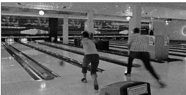
Mit vollem Schwung im Einsatz.