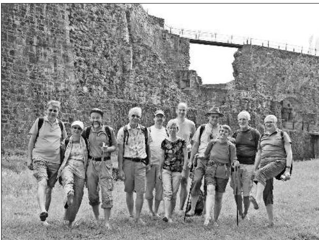
Auf der Hochburg.