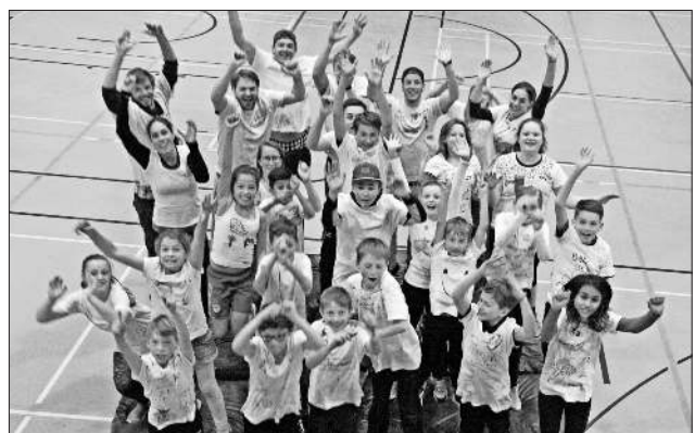
Teilnehmer, Mitarbeiter und Studenten beim Camp Konstanz.

Für weitere Informationen stehen die SpoFunnis-Mitarbeiter und Mitarbeiterinnen unter spuero@spofunnis.de sowie Telefon 07641 / 9379999 gerne zur Verfügung.