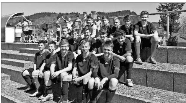
Die Sieger im Kreisfinale in Freiburg.

Wie schon im Jahr zuvor erreichten die Teninger Realschüler den Einzug ins Finale auf der Ebene des Regierungspräsidiums. Man darf gespannt sein, wie sie sich dort unter acht Mannschaften behaupten werden.