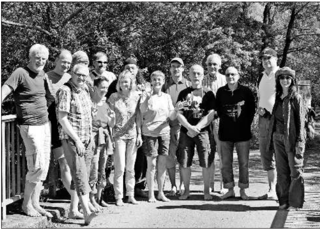
Ein Teil der Teilnehmer im Taubergießen

Auch der Straußenbesuch kam in diesen Tagen nicht zu kurz und man ist dankbar, dass der Wettergott auch ein Barfüßer zu sein scheint, machte doch das Wetter just an diesem Donnerstag die erhoffte Kehrtwende.