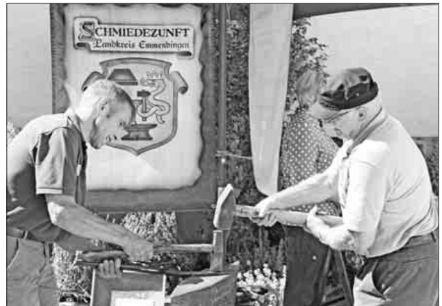
Am Gemeindestand zeigte die Schmiedezunft des Landkreises Emmendingen ihr Können.