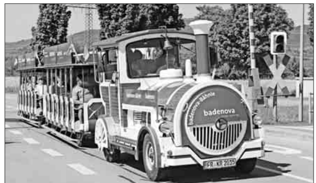
Das Badenovabähnle verkehrte im Halbstundentakt zwischen dem Nimburger Bahnhof und dem Festgelände.