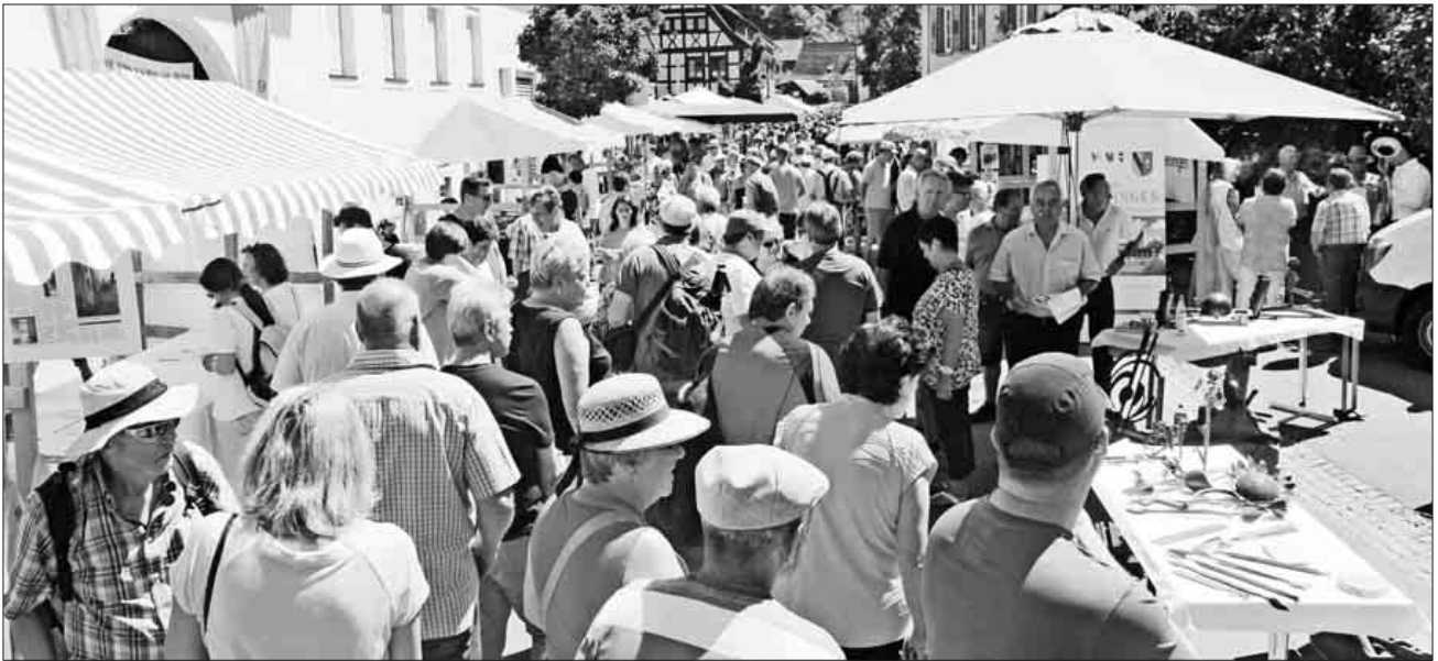
Die Kaiserstuhl-Tuniberg-Tage waren ein Besucherhit. Vor allem am Sonntagnachmittag war in der Langstraße das Interesse groß.

» Zweitägige Regionalschau hatte Anziehungskraft