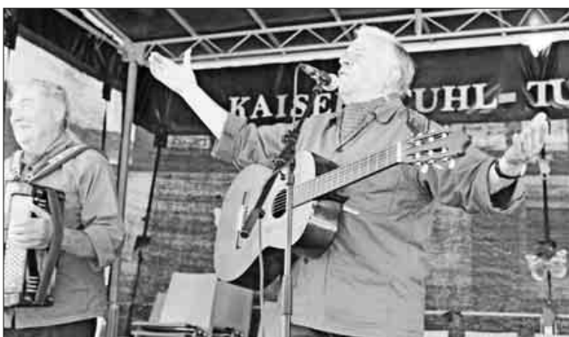
Die singenden Winzer aus Ihringen präsentierten außer heimlichen Liedern auch zum Teil deftige Witze.