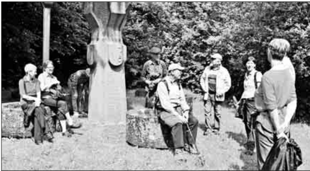
Die Teilnehmer waren am Ende des südlichen Gallusrundwegs über vieles gut informiert.