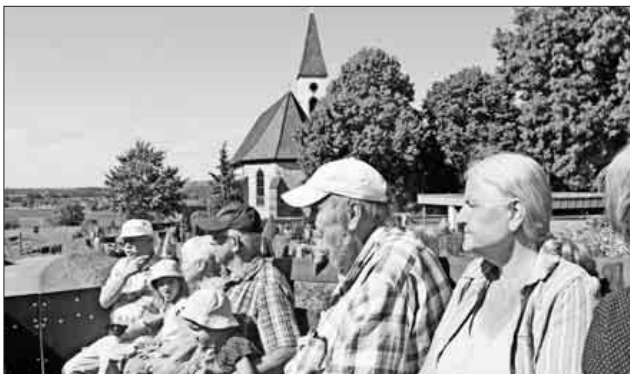
Eine Weinbergfahrt führte die Winzergenossenschaft Nimburg-Bottingen durch. Auch an der Nimburger Bergkirche gab es einen Stopp.