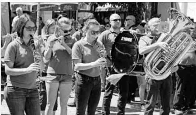
Der Musikverein Nimburg-Bottingen sorgte für die musikalische Umrahmung der Eröffnung.