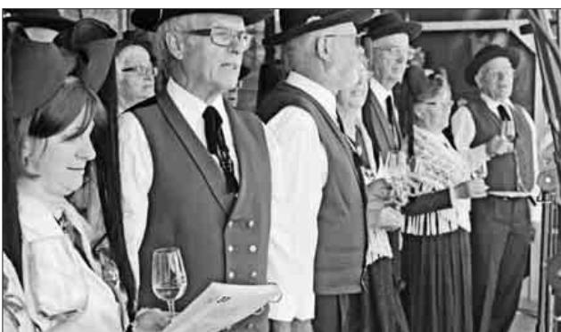
Die Ihringer Trachtengruppe präsentierte auf der Hauptbühne Heimatlieder und Mundartgedichte.