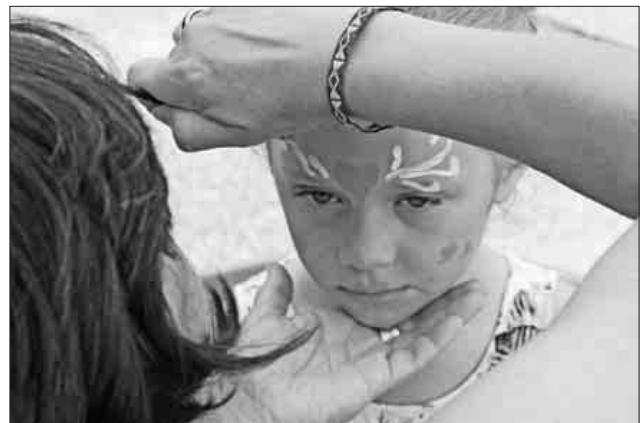
Geduldig ließen sich die Kinder schminken.