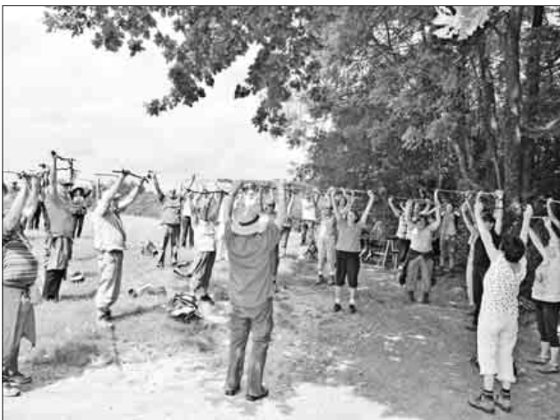
Koordination-, Gleichgewichts- und Atemübungen beim Gesundheitswandern

Treffpunkt und Abschluss: Parkplatz am Teningen Trimm-dich-Pfad.