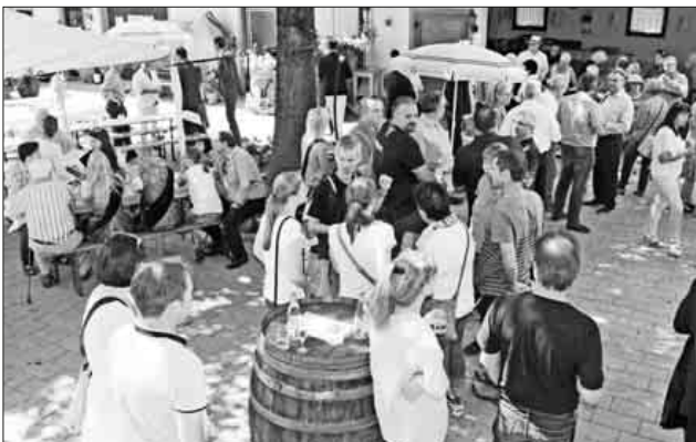
Bei einem Empfang mit Sekt und Häppchen wurden am Samstagnachmittag die Ehrengäste im Weinhof Mick begrüßt.

aber die Fotos auf dieser und den nächsten Seiten sprechen für sich. Kurzum: Nimburg zeigte sich von der besten Seite, alle waren zufrieden und die Veranstaltung wird noch lange in Erinnerung bleiben, was sich auch in den überaus positiven Kommentaren der Gäste widerspiegelt.