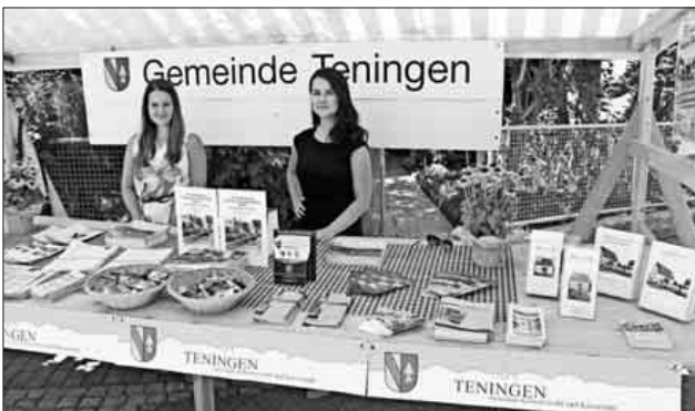
Selbstverständlich präsentierte sich auch die Gemeinde Teningen mit einem Stand bei den Kaiserstuhl-Tuniberg-Tagen.