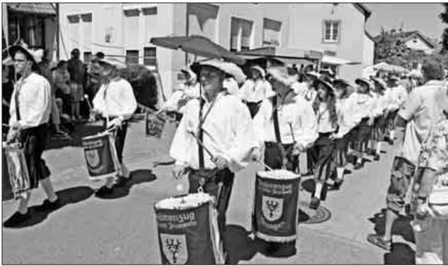
Der Historische Fanfarenzug der Freiwilligen Feuerwehr Teningen machte am Sonntagnachmittag auf dem Festgelände seine Aufwartung.