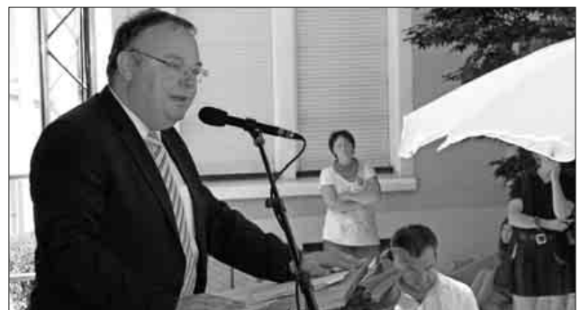
Bürgermeister Heinz-Rudolf Hagenacker sprach die Begrüßungsworte.