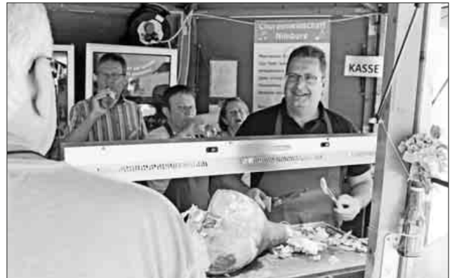
Beinschinken gab es am Stand der Chorgemeinschaft Nimburg. Dort gab es für alle Besucher sogar ein „Probiererle“.