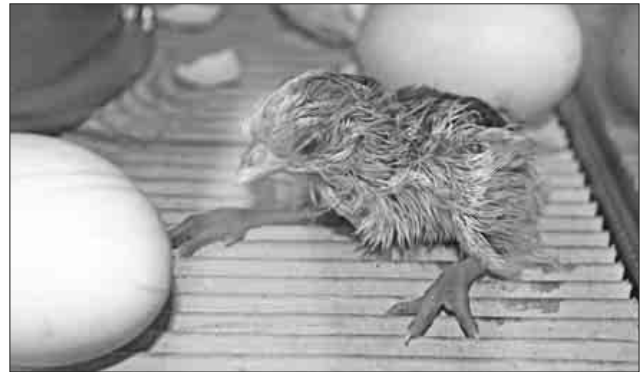
Beim Kleintierzuchtverein Nimburg-Reute könnte man zuhause, wie Küken schlüpfen.