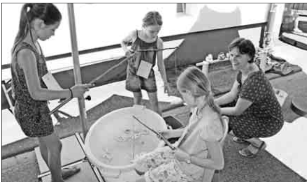
Für das Kinderprogramm sorgten die Kindergärten Regenbogen und Sonnenschein sowie das Öko- und Spielmobil der Gemeinde Teningen.