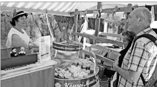
Stark nachgefragt waren auch die Ziegenkäseprodukte der Teninger Käserei Monte Ziego.