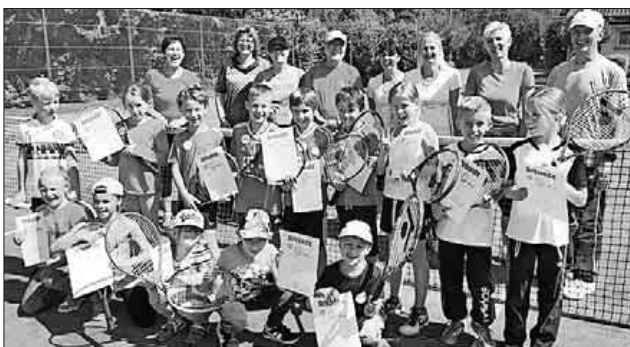
Kindertag der Heimbacher Grundschule beim TC Heimbach.