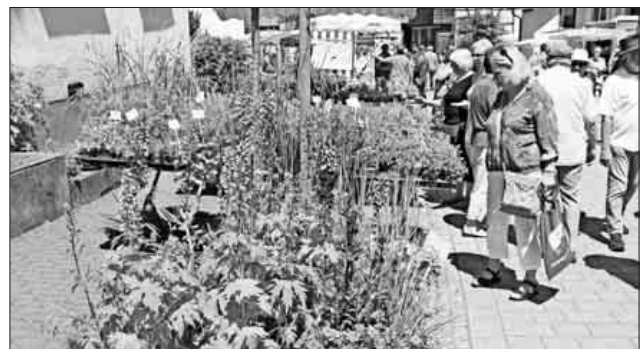
Ein wahres Blumenmeer gab es bei der Sasbacher Gärtnerei Friderich zu bestaunen.