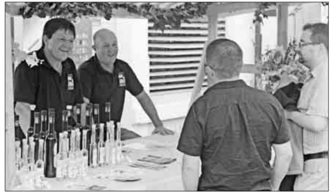
Hochprozentiges gab es bei den Kaisersthüler Edelbrennern.