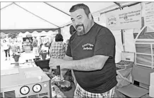
Das Bier der Köndringer Dorfbrauerei war aufgrund der hohen Temperaturen der Hit.