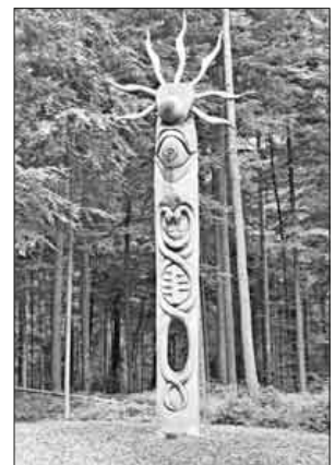
Holzskulptur am Eingang des Walderlebnispfades.

Der Schwarzwaldverein veranstaltet im Rahmen der Ferienspaßaktion der Gemeinde am Samstag, 30. Juli, einen Walderlebnistag unter dem Motto „Natur spielerisch entdecken“ für Kinder und Eltern, Enkel und Großeltern. Hildegard und Kurt Armbruster werden die Teilnehmer an diesem Tag begleiten und ihnen unterschiedliche Themen auf kreative Weise nahebringen. Der Erlebnispfad ist für Kinderwagen und Rollstuhl geeignet. Abfahrt und für diejenigen, die eine Mitfahrgelegenheit suchen, ist um 10 Uhr bei der Ludwig-Jahn-Halle in Teningen. Bitte geeignete Kleidung, Rucksackverpflegung und Grillgut mitbringen. Anmeldung bitte bis Freitag, 22. Juli, bei Hildegard Armbruster unter Telefon 07641 / 47559.