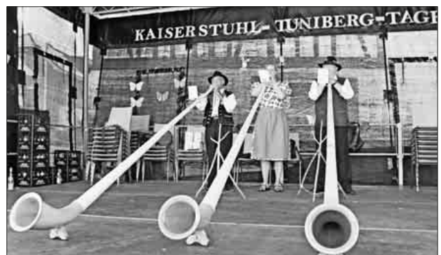
Einen außergewöhnlichen Auftritt hatten die Lilientaler Alpenhornbläser.