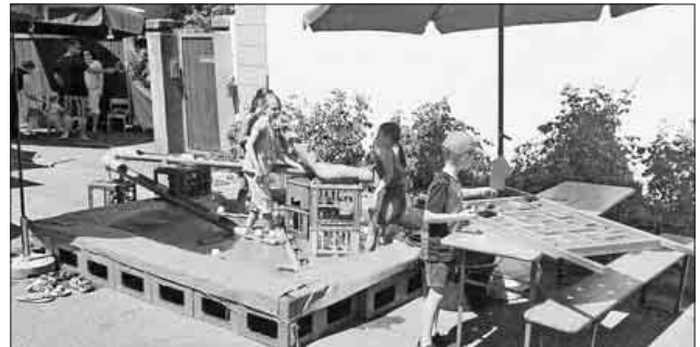
An der Wasserbaustelle war Abkühlung angesagt.

Bei der diesjährigen Auflage der Kaiserstuhl-Tuniberg-Tage beteiligte sich auch wieder das Kinder- und Jugendbüro Teningen. In Kooperation mit dem Nimburger Kindergarten „Regenbogen“ und „Sonnenschein“ aus Bottingen konnte eine Spielstraße angeboten werden. Sowohl am Samstag also auch am Sonntag wurde bei hochsommerlichen Temperaturen gespielt, geschminkt und gebastelt, was das Zeug hielt. So wurden immer wieder auch Piraten auf hoher See an der Wasserbaustelle gesichtet, Löwen und Feen an der Rollenrutsche oder dem Bobbycar-Parcours beobachtet. Ab und an „verirrten“ sich auch größere Kinder im Alter zwischen 20 und 80 an den Tischkicker oder die vorbereiteten Geschicklichkeitsspiele.