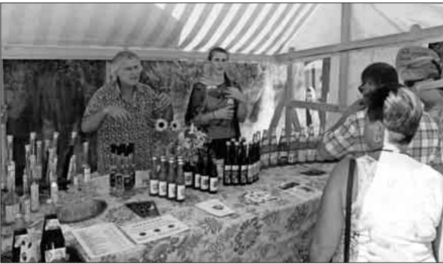
Auf großes Interesse stieß an beiden Tagen der Regionalmarkt. Auch Anbieter aus der Gemeinde wie hier Jung-Fruchtsäfte aus Köndringen waren dabei.