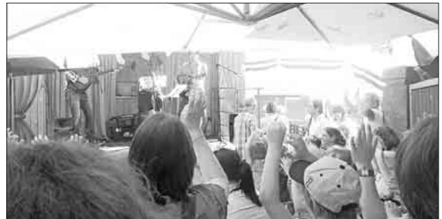
Alle waren voll dabei beim Auftritt von RATZFATZ.