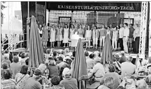
Für viel Schwung sorgte der Nimburger Pop- und Jazzchor Chorissimo.