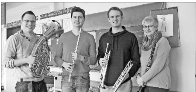
Die Musiker der Musik- und Feuerwehr Kapelle Teningen zu Besuch in den Teningen Grundschulen.