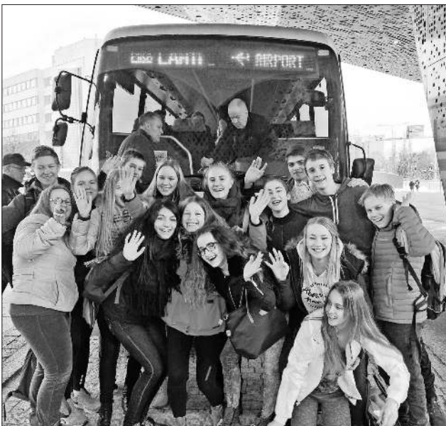
Die finnische und deutsche Schülergruppe beim Besuch in Finnland.

Es wurden viele Erfahrungen gesammelt. Während des Aufenthalts entstanden etliche Freundschaften, die unter anderem auch durch die neuen Medien vertieft werden. Leider ging die Woche in Finnland viel zu schnell vorüber. Die Freude auf ein baldiges Wiedersehen ist sehr groß.