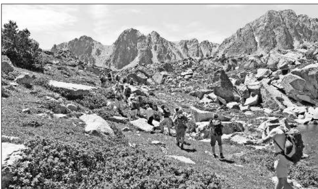
Wanderungen in faszinierender Gipfelkulisse.

Der Schwarzwaldverein wandert vom 7. bis 14. Juli in einer der schönsten Naturidyllen der Pyrenäen mit Standquartier. Es sind noch wenige Plätze frei. Nähere Auskunft erteilt Kurt Armbruster, Telefon 07641 / 47559.