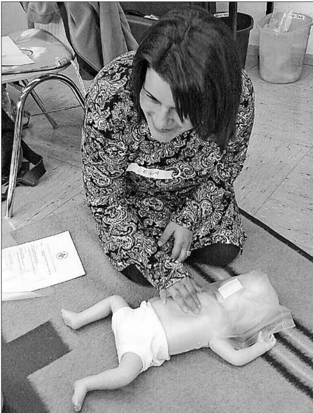
Eine Lehrgangsteilnehmerin bei der Wiederbelebung eines Säuglings

teilnehmer ganz schön ins Schwitzen, es war voller Körpereinsatz gefragt. Viel Spaß bereiteten vor allem die praktischen Übungen im Teninger Maiwäldle. An lebensnahen Situationen mussten die zuvor gebildeten Teams das Gelernte und Geübte auf sechs Übungsstationen umsetzen. Eindrücklich für alle Teilnehmer zeigte sich immer wieder, wie komplex Unfallmeldungen sein können. Wohin sollen die Retter kommen? Den Teilnehmern wurde bei den gestellten Gruppenaufgaben rasch bewusst, um wie viel schwieriger es sein mag, bei „echten“ Notfällen unter Stress zu handeln. Deshalb gilt, immer Ruhe bewahren und in jedem von uns steckt ein Lebensretter. Die zahlreichen ganz realistischen Unfallsituationen hatten gelehrt, wie wichtig das richtige Management ist. Oft reicht es aber auch, für den Verletzten einfach nur an seiner Seite zu sein. Denn es gibt nur eines, was man falsch machen kann: gar nichts tun. Fazit der Lehrgangsteilnehmer: „Das war interessant, war kurzweilig, bleibt in Erinnerung und ist im Notfall abrufbar“. Man war sich einig, dass eine Wiederholung der Erste-Hilfe alle zwei Jahre zur Auffrischung sinnvoll ist. Nicht nur für die Arbeit mit den Kindern, sondern auch im normalen Alltag.