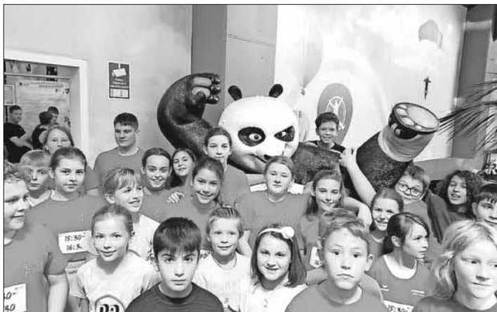
Die Kinder im Kiddy-Dome.