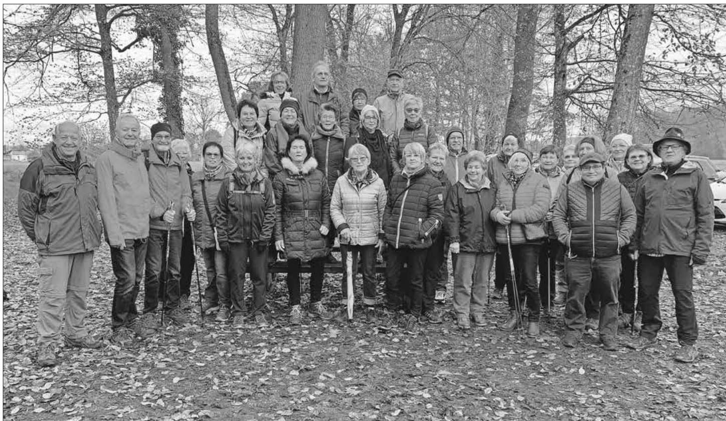
Die Teilnehmer genossen die Gesundheitswanderungen im Teningen Allmendwald.