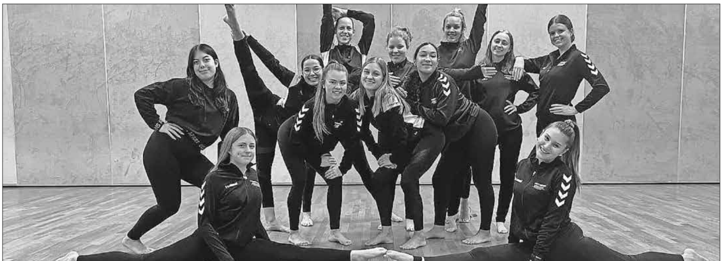
Die Gruppe Effect

viele Formationen an der Weltmeisterschaft teilnehmen dürfen. Die Freude war riesig, als die Tanzformation erfuhr, dass sie an der Weltmeisterschaft am morgigen 1. Dezember Deutschland vertreten darf. EM- und WM-Qualifikation in einem Jahr: mehr geht nicht. Austragungsort ist das ferne Podcetrtek in Slowenien, unweit zur Grenze zu Kroatien. Die einzigen Wermutstropfen sind die erheblichen Reisekosten; „keine Rosen ohne Dornen“. Aus diesem Grund ist die Mannschaft nun auf der Suche nach Sponsoren, welche diesen für den TSC Teningen bislang einmaligen Erfolg finanziell unterstützen. „Effect“ und der TSC Teningen freuen sich über jede Kontaktaufnahme.