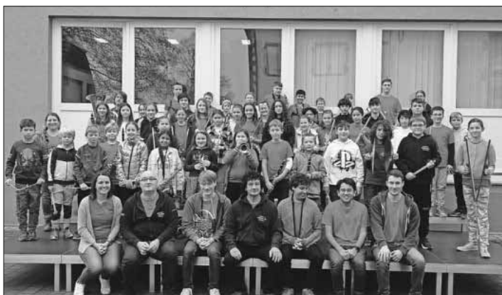
Ein Teil des gemeinsamen Jugendorchesters vor dem „Haus der Musik“.

Informationen zur Bläserjugend erteilt Mennie Lang unter Telefon 07641 / 954832 oder E-Mail: jugend@winzerkapelle.de.