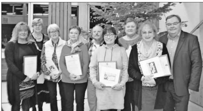
Die Dienstjubilare und die verabschiedeten Mitarbeiter wurden von Bürgermeister Hagenacker geehrt.