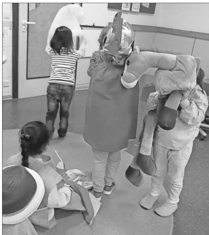
Die Kinder beim proben für ihren Auftritt.