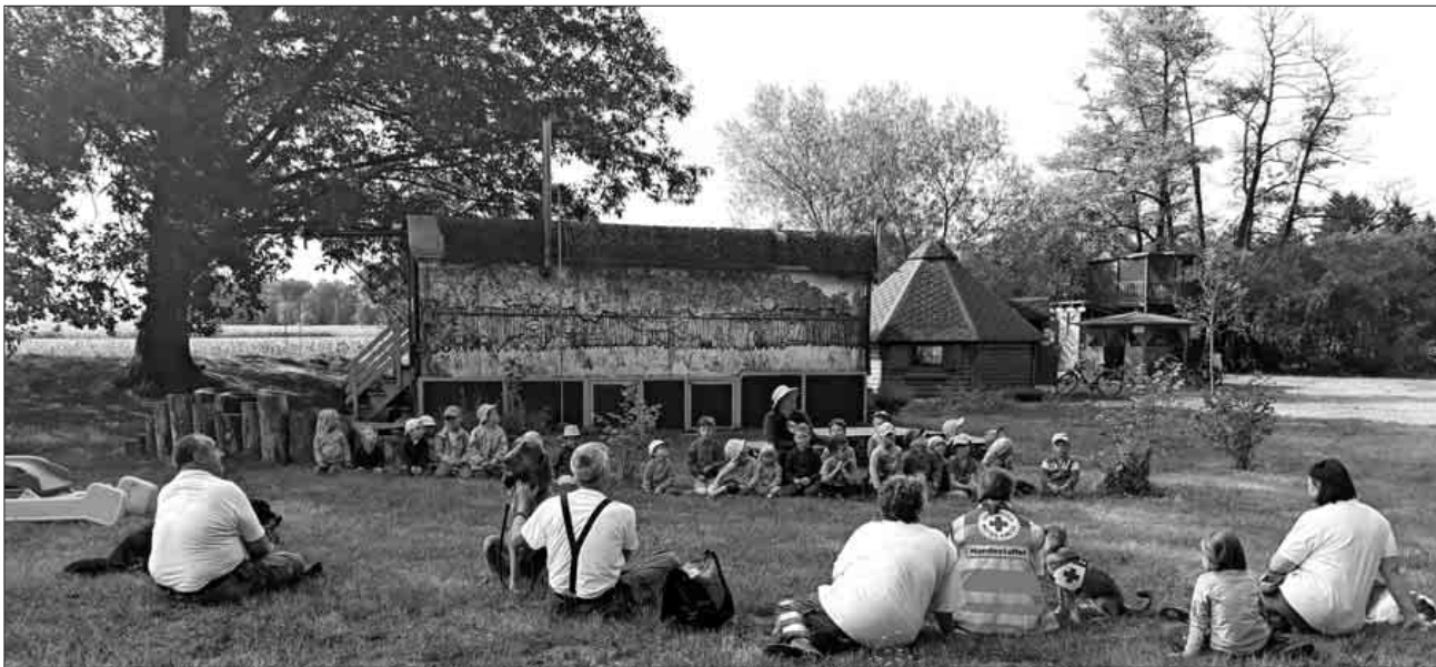
In einem Sitzkreis im Freien erklärten die Verantwortlichen der Hundestaffel den Kindern, was die Aufgaben der Hundestaffel sind.