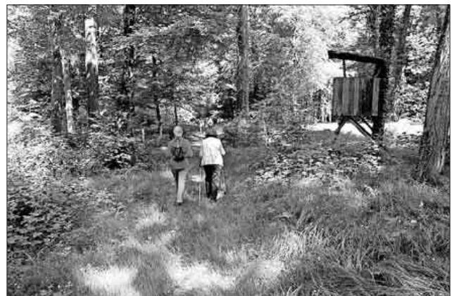
Eintauchen ins Grün des Rheinauwaldes und dabei den Alltag vergessen.

Der Schwarzwaldverein lädt am Donnerstag, 5. September, zum Radeln nach Wyhl und Wandern auf dem Naturlehrpfad „Rheinauwald“ im Wyhler Wald ein. Die Teilnehmer können auf dem Lehrpfad einen Laubmischwald mit Eschen, Ahornarten, Stieleichen, Linden, Hainbuchen, Ulmen, Kirschen, Birken, Erlen, Weiden und Schwarzpappeln erleben. Treffpunkt: 11 Uhr an der Ludwig-Jahn-Halle. Rucksackverpflegung wird empfohlen. Ein Einkehrschwung ist vorgesehen im Café Mathilde. Rückkehr in Teningen gegen 17 Uhr. Anmeldung bitte bis Dienstag, 3. September , bei Kurt Armbruster, Telefon 47559.