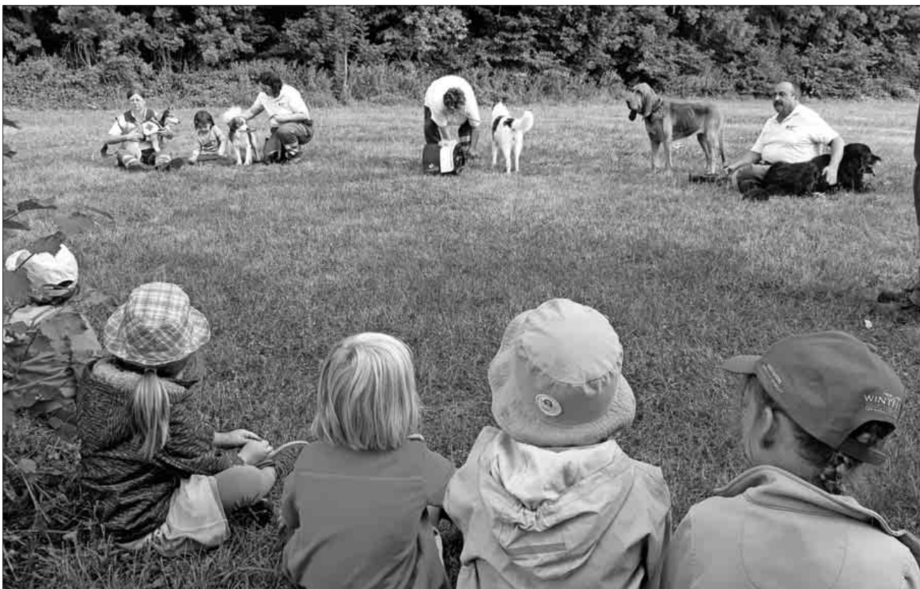
Die Kinder beobachteten die Hunde genau.

Ausdrücklich ist an dieser Stelle der Schutzhundestaffel für ihren tollen Besuch im Kindergarten zu danken. Es war ein eindrücklicher Morgen!