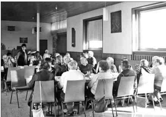
Der Vortrag über den Schutz vor der Kriminalität wurde beim Gemeindegemeinschaft gut besucht.