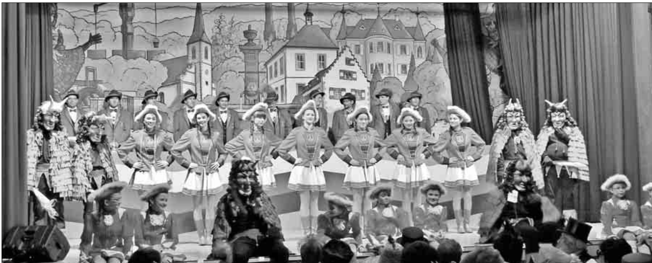
Immer wieder ein schönes Bühnenbild.