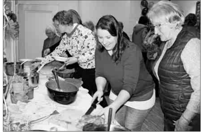
Am Büfett konnten slowenische Gerichte und Gebackenes gekostet werden.