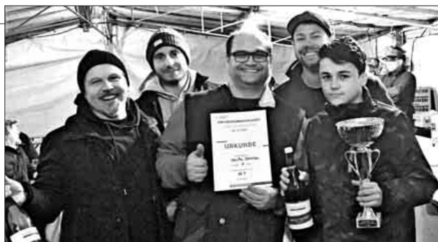
Das Siegerteam „Heiße Scheibe“ mit den Wertungsrichtern.

Ein Dank geht auch an alle Helfer, die das Scheibenschlagen auf- und abgebaut und am Samstag und Sonntag bewirtet haben.