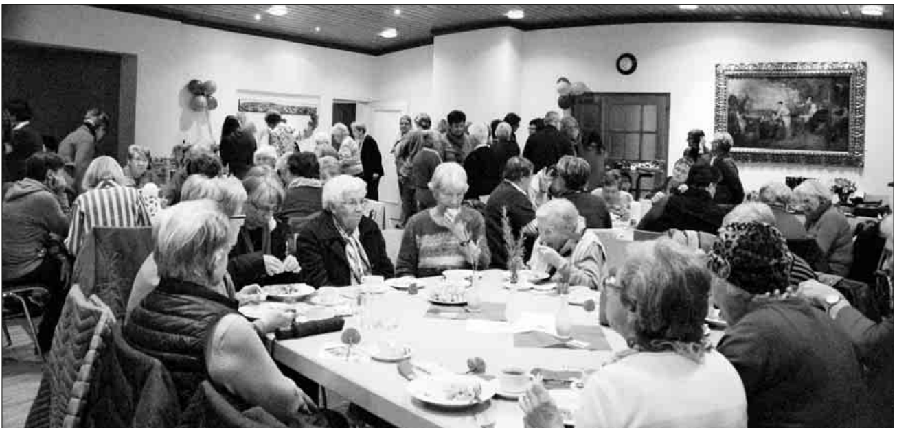
Das evangelische Gemeindehaus war, wie schon der Gottesdienst, gut besucht.

Nächstes Jahr, wieder am ersten Freitag im März, kommt die Gottesdienstvorbereitung aus Simbabwe und wird von den Nimburger Frauen organisiert.