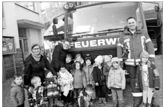
Die Kinder erkundeten mit großem Interesse das Feuerwehr-auto.

Der Kindergarten bedankt sich für die Präsentation bei Herrn Nahr. Die Freiwillige Feuerwehr freut sich über Interessentinnen und Interessenten jeden Alters. www.Feuerwehr-teningen.de .